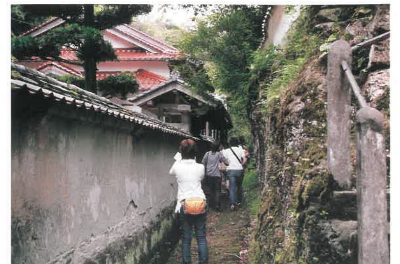
▲銀山街道の一部「温泉津沖泊往還」