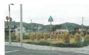
▲みちのくの田園風景

私が、最初に石見と陸奥の文化の違いを感じたのは、見慣れた田園風景の中にある稲の乾し方でした。こけしのような稲掛けを見て、同じような乾し方をする温泉津町の西田地区のヨヅクハデを思い出しました。ところ変われば乾し方も変わる、みちのくの文化を感じました。