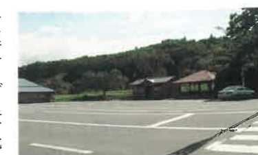
▲達谷窟 バリアフリーのトイレと駐車場

現在、世界遺産登録に向けて島根県・大田市・温泉津町・仁摩町は一丸となって、諸課題に取り組んでおりますので、御協力をよろしくお願いいたします。