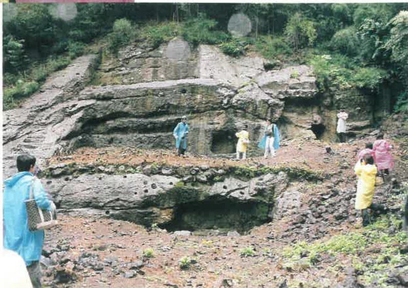
▲謎の岩盤遺構 釜屋間歩

石見銀山は日本の中では佐渡や生野の銀山同士の繋がり、世界で言えば中国を中心とする東南アジア・東アジア海域貿易の中での銀の流通に大きく関与してい