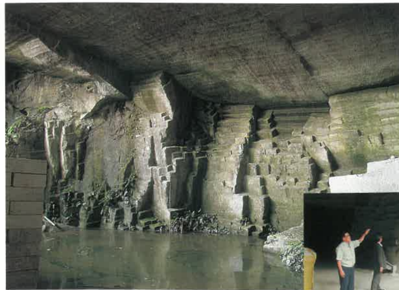
▲福光石の石切場跡

前述のように、この遺跡群の諸所には銀山と関連して豊富な石造物が残されました。その多くがこの福光から供給されたという歴史、そして、その痕跡がいまも良好に残されているという事実を、改めて印象づけられた日でした。