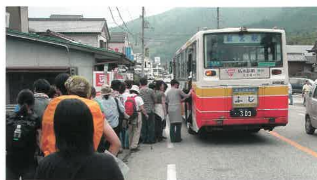
▲バス乗車の混雑模様

熊野古道での多くの来訪者を見ると、老若男女個人から団体まで本当に様々な人がいました。また今回はあまり見かけませんでしたが、外国人も多く訪れてくるでしょう。平成19年以降、石見銀山はどのように来訪者を受け入れているのでしょうか。