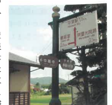
▲平泉町設置の誘導サイン