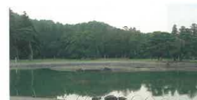
▲毛越寺 浄土庭園大泉が池

平成20年登録を目指す「平泉の文化遺産」は、中尊寺と毛越寺、無量光院跡、柳之御所跡を中心に平安末期の約100年間に都の文化を受容しながら独自に発展させた仏教寺院、浄土庭園など華麗な黄金文化の遺産群で、古代から中世への過渡期の地方文化として突出した事例として評価されています。