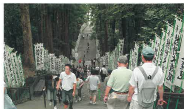
▲熊野本宮大社参道