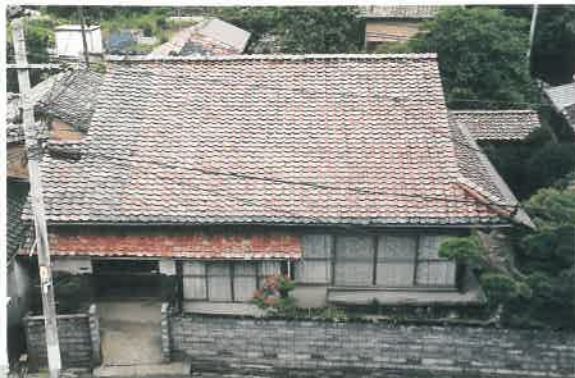
〈修理前〉(観世音寺境内より)

大森町昭和区。銀山へ向かう街道の西側に位置し、武家様式を持つ建物です。明治中期から昭和初期まで医院として使用されており、正面はそのための改造が行われていました。玄関右手の3畳間は大正のころに診察室として増築されたものですが、部屋内の化粧板をはがすと長押(なげし)が架けられていた痕跡などかつては式台だったことが判明したため、