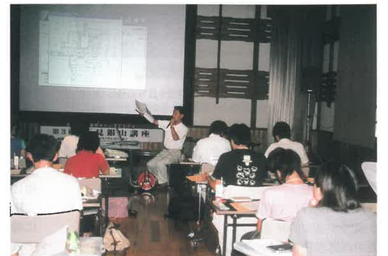
▲総合調査の説明風景

四泊五日の日程で、一流の講師陣の講義を受け、また、実際に石見銀山遺跡の現地を見て回ることのできる絶好の機会となった本講座が、未来の石見銀山を研究する担い手の切っ掛けになっていること期待しています。