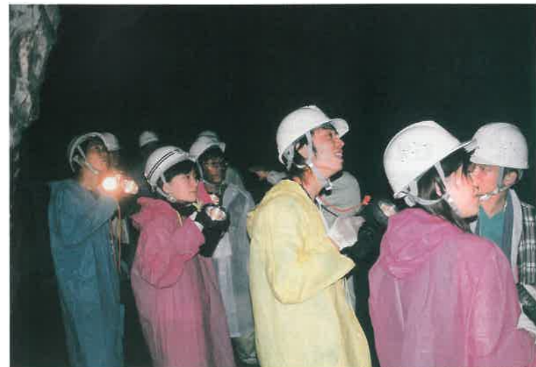
▲大久保間歩坑道内(※一般公開はしていません)

今年で3回目になるこの講座は、国立三瓶青年の家(大田市三瓶町)を主会場に、全国から歴史・デザイン・建築等を専攻する大学生・大学院生の精鋭二十三名が集まりました。