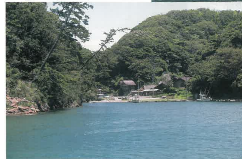
◀沖泊 恵比寿神社と浜