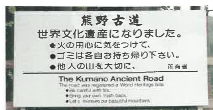
▲来訪者へのマナー喚起