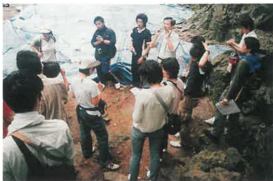
▲出土谷地区の発掘現場での説明(フィールドワーク)

2日目のフィールドワークでは、石見銀山遺跡の中で最もスケールの大きな生産遺跡のひとつである「大久保間歩」のほか、「龍源寺間歩」、灰吹銀の出土した「出土谷遺跡」、明治の産業遺跡「清水谷製錬所跡」など多彩な遺跡を巡りました。