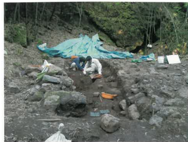
▲釜屋間歩付近調査風景

こうした調査の結果を検討することによって、石見銀山の最盛期といわれる時期の銀山全体の様子がさらに具体的になっていきます。一般公開の現地見学会は11月30日に開催する予定です。