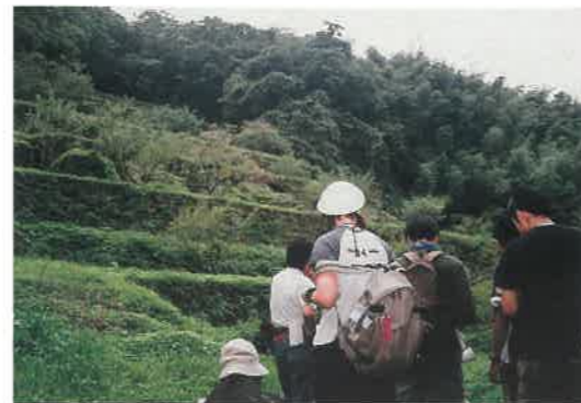
▲清水谷製錬所跡の見学(フィールドワーク)

4泊5日の日程で、各分野の講師陣の講義を受け、また、実際に石見銀山遺跡の現地をくまなく見学できる本講座が、未来の研究者への夢を大きく切り開ききっかけとなることを期待しています。