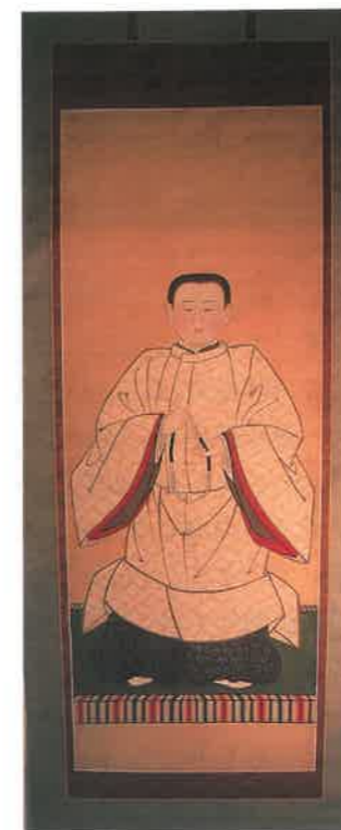
②道策入門時の肖像画

山崎家には道策が床几に肘をつきゆったりと休息する肖像画(写真③)も伝わりますが、これはそのポーズから柿本人麿像を意識して制作されたものと考えられます。かつて歌聖である人麿の像を祀って歌を献ずる「人麿影供」が盛んに行われましたが、同じく碁聖といわれた道策の肖像を掛け、その前で碁に関する様々な催しが行われたのでしよう。