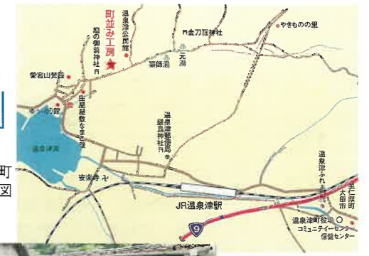
▶ 温泉津町中心地区