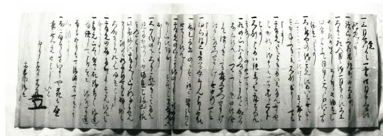
▲年未詳 卯月十六日 大久保長安書状