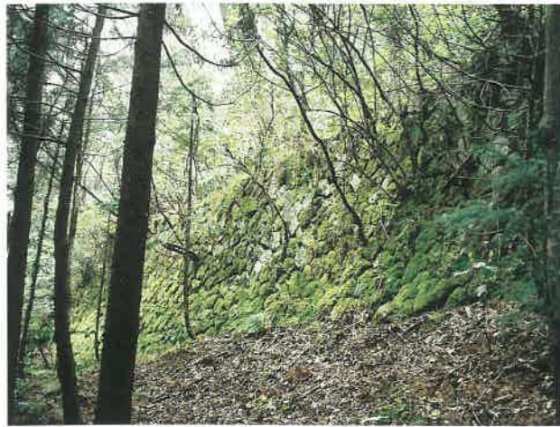
▲五老橋から降路坂に向かって1km付近 五老川の右岸、街道沿に位置する石垣

銀山街道の西田五老橋から銀山柵ノ内に向かう急峻な峠を降路坂とよびます。この降路坂に謎の石垣道が現れます。謎の石垣道とは降路坂の山腹に築かれた道幅2間（約3.6m）の旧道で、この道がルート