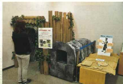
▲情報コーナーに設置した手作りの坑道(間歩)体験コーナー