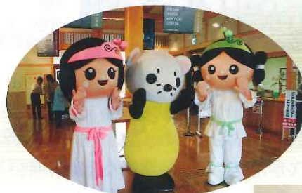
7月の登録記念月を中心に島根県立古代出雲歴史博物館と島根県立三瓶自然館、石見銀山世界遺産センター3館巡回イベントを行いました。