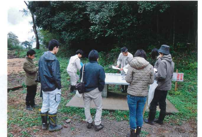
▲仙ノ山頂上付近・石銀藤田地区の鉱山町跡を現地視察

これらを通じて、現在は山林となっている土地にもかつては寺院・工房・町家などが建ち、様々な人々が暮らしていたことがあらためてわかってきました。今後は、遺跡構成要素をより詳しく調べ、最盛期の景観を描き出していきます。