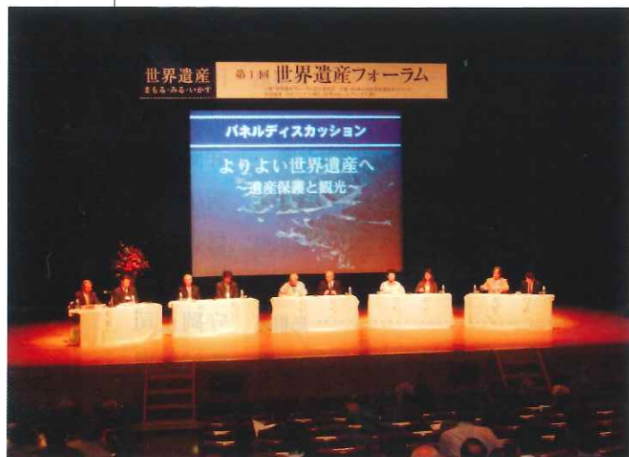
▲パネルディスカッションの様子