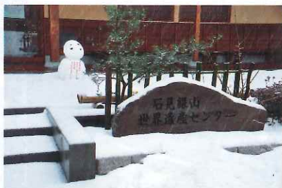
▲雪の世界遺産センター

「石見銀山ニュース」15号をお届けします。石見銀山世界遺産センターにお立ち寄り下さい。