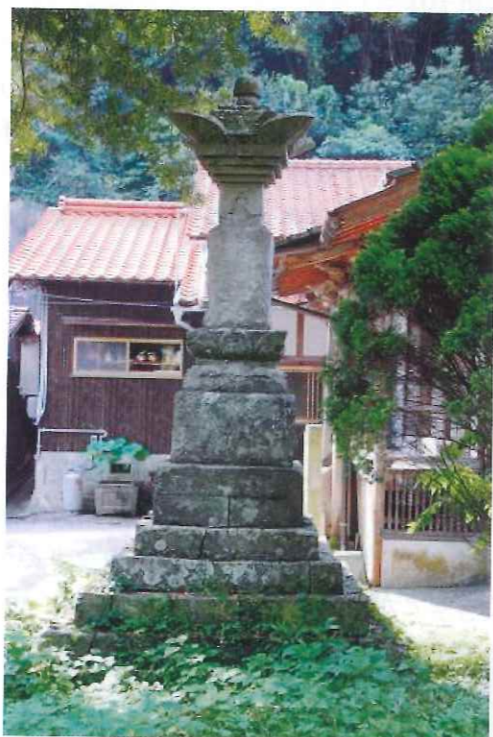
▲金剛院墓地の宝篋印塔

金剛院には高さ約4mの石塔があります。石材の表面は剥離していますが、一部に寄進した人と考えられる人名がありました。人名には温泉津の商人や大森の地役人などがありました。人名や石塔の形から18世紀末～19世紀前半に造られていることがわかります。何を願ってこの石塔が建てられたのか謎ですが、実測や写真撮影を通じて、歴史を後世まで伝えていきたいと思っています。