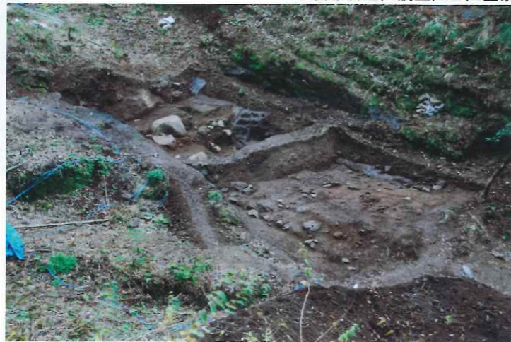
▼安原谷地区調査区II区全景

III区は、水害により遺構面が壊されている部分もありましたが、2面の遺構面と石垣等を確認しました。遺構面には粘土が貼られ、土間面が存在していたと思われるが、明確な遺構は確認できず、柱穴状の遺構を2基検出したのみです。また、石垣の下のほうには石垣を埋めるように意図的に廃棄したと考えられるズリが厚く堆積していました。