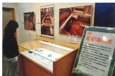
▲情報コーナーで行った「企画展 発見! 地下に眠る大森の町」