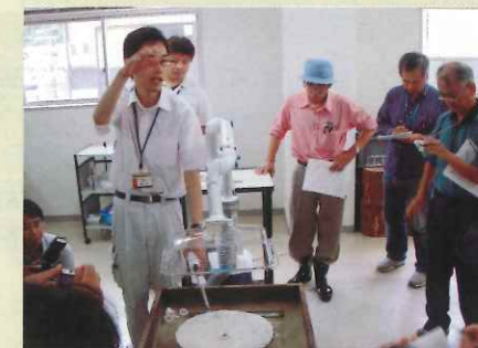
「銀山の製錬作業」体験イベント

7月11日は、『銀山の製錬作業～選鉱体験・灰吹実演』の体験イベントを開催しました。実際に鉾石を細かく砕く作業(こなし)、銀をゆり盆で抽出する作業もあわせて体験してもらいました。また、石見銀山の銀産出量を飛躍的に高めた「灰吹法」の実演見学も行いました。こなし作業では、「思ったより難しい、力加減が強いと飛び散って細かく砕くことができない。繊細な作業であるこなし作業に女性が活躍したのもうなずける」と感心の声も上がりました。