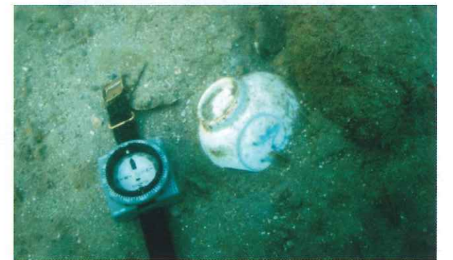
▲沖泊海底で発見された江戸時代(18世紀)の染付磁器碗(左は方位磁石)

今回は、海底とはいえ、遺跡の表面を観察するという、遺跡の確認調査でしたが、発掘調査も含めて、今後も調査が継続される予定です。江戸時代の文献資料にも、港内で暴風により壊れたり、瀬に乗り上げて沈没した船の記録が残っていることから、将来海底に埋もれた貴重な遺物が発見されることを期待したいと思います。