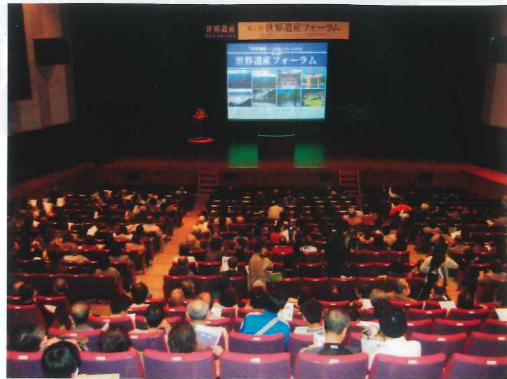
▲大田市民会館でのフォーラム

なお、このフォーラムについては、世界遺産所在地の地方新聞社14社によって設立された「世界遺産ネットワーク」とも協力しながら、各地域での継続的な開催を模索することとしています。