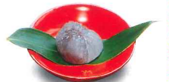
▲手作りの葛まんじゅう(夏)