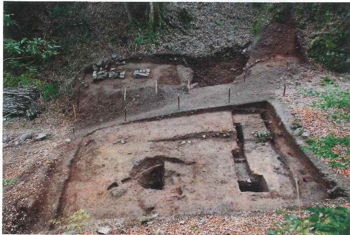
▲本谷地区調査区I区(手前)・II区(奥側)全景

本谷地区では、露頭掘り前側に造成された平坦地(I区)及び、露頭掘り直下(II区)の2か所を調査しました。