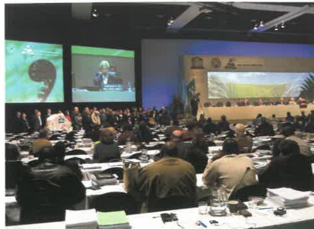
▲世界遺産委員会最終日の会場

南米チリを皮切りに次々と「登録」を支持する意見が相次ぎ、大勢が決まりました。意見の概要は、16世紀からすでに環境に配慮し、自然と共生した鉱山経営が行われてきたことを高く評価し、世界遺産一覧表を豊かにする意義がある、というようなものでした。ただし、決議に付帯する勧告内容についてはいろいろと意見があり、「石見」の審議は、通常の審議時間の3倍約45分に及びました。