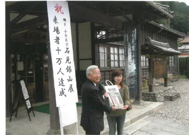
▲10万人達成セレモニー(於:石見銀山資料館)