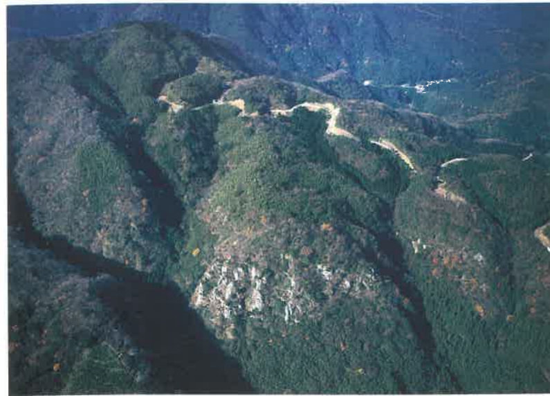
▲銀鉱山の中心地 仙ノ山