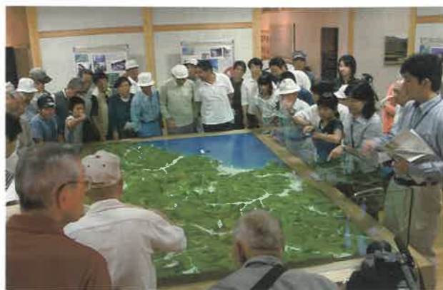
▲展示室内におけるガイダンス風景

来年10月に予定しているフルオープン後は、遺跡のガイダンス、調査研究及び保全管理の機能を有する石見銀山遺跡の拠点施設としての役割を果たすこととしていますが、当面、ガイダンス棟内では、展示や映像などを利用した遺跡のガイダンスを中心に運営していきます。