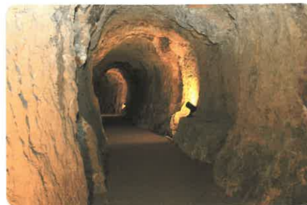
▲きれいに舗装された龍源寺間歩坑内

大久保間歩は、平成14年度から島根県教育委員会が実施主体となり、年に数回の一般公開(探索ツアーなど)が行われていましたが、いよいよ平