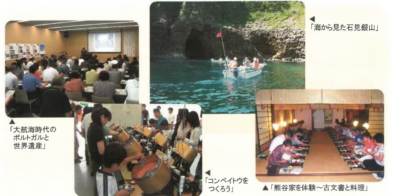
▲「大航海時代のポルトガルと世界遺産」