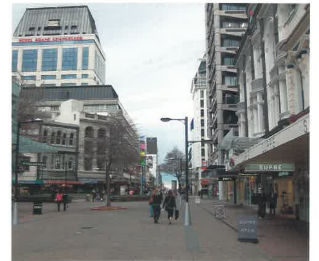
▲クライストチャーチの町並み

現在、1締約国からの推薦数は1年当たり2件まで(2件の場合は最低1件は自然遺産)と定められていますが、来年から4年間に限り、各国の歴史的・地理的状况に応じて、文化遺産2件の推薦も認められることになりました。