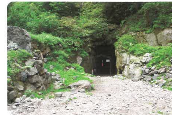
▲大久保間歩坑口付近に設置された落石防護柵