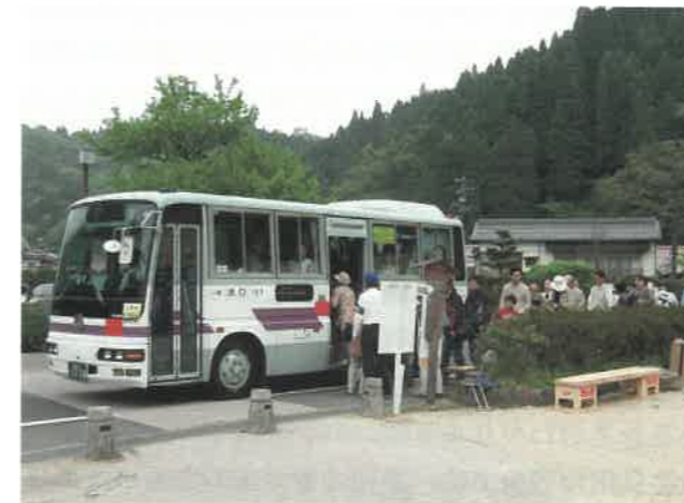
▲パークアンドライド

イコモスによる登録延期勧告に関わらず世界遺産委員会で登録決議がなされたことで県内外の大きな関心と呼び、登録直後の夏場には予想をはるかに超える来訪者がありました。鉱山町である大森町では、観光バスの事前予約、自家用車を町から離れたところに駐車してもらい公共交通で町なかに誘導するパークアンドライド方式の実施など、来訪者に満足してもらえ、かつ、住民生