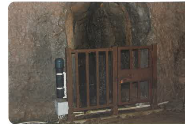
▲斜坑前に設置された柵と温湿度計(左側の筒)