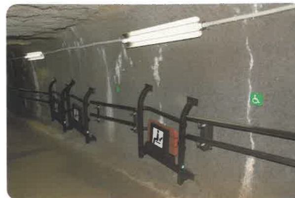
▲新坑道に設置された手摺と休憩用の椅子