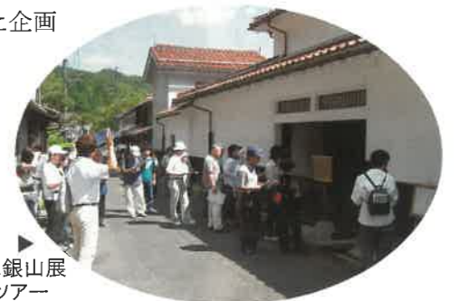
▲石見銀山展ミニツアー