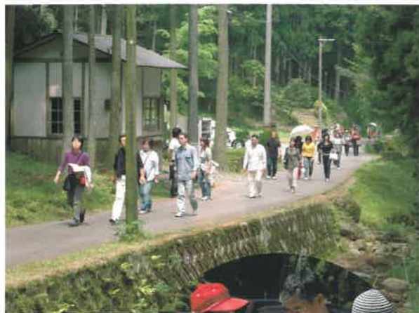
▲徒歩で龍源寺間歩へ向かう観光客

このような状況の中、現地で観光客を受け入れるための対策として、遺跡や自然環境の保全と地域住民の生活を守ることを前提に、パークアンドライドを中心とした受入対策を4月28日から実施しています。これは、大森町内への観光車両の流入を抑えるため、大森町南東部に位置する「ふれあいの森公園」に整備した石見銀山駐車場(400台収容)を拠点として観光車両を集中させ、ここを起点に町並みや龍源寺間歩などをゆっくりと