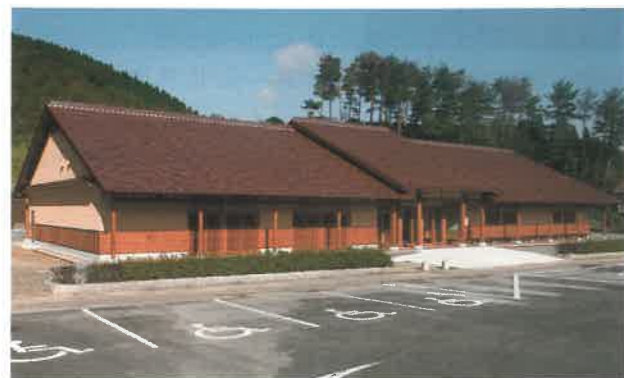
▲ガイダンス棟外観

地元の方々から見れば、見慣れたごく普通の体裁ですが、来訪者の方々に当地域の文化を理解していただく一助となるよう工夫したところです。