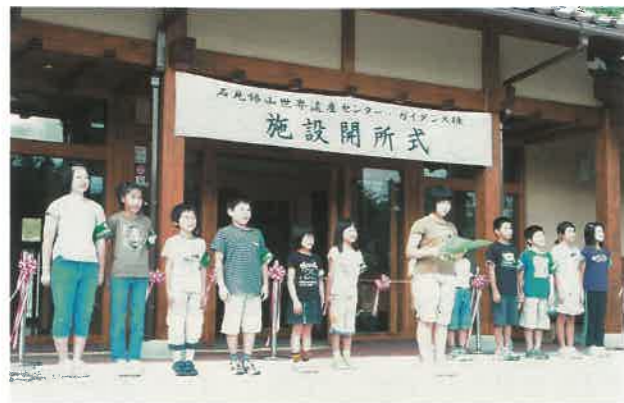
▲開所式(石見銀山愛護少年団による銀山宣言)

同センターは、大田市が平成17年度から整備に着手し、現在も展示棟及び収蔵・体験棟の整備を継続中です。