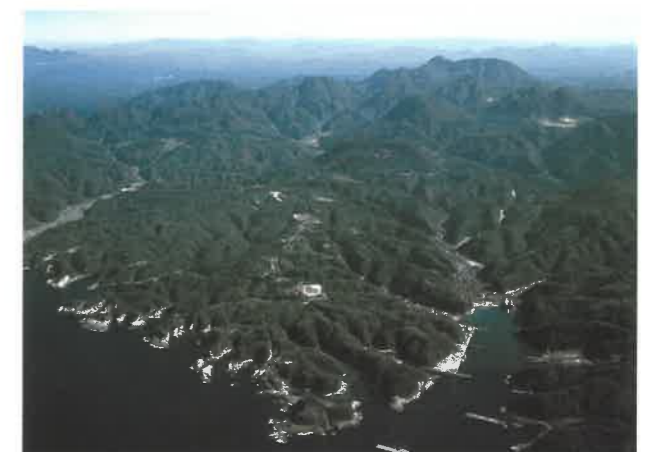
▲海から見た石見銀山

石見銀山遺跡に観光地としての利便性を求める意見もあり、その対策もまだまだやっていかなければなりません。しかし、最も大事なことは、上記の精神に基づき、国内外の多くの方々に「世界遺産 石見銀山遺跡とその文化的景観」の顕著な普遍的価値を理解していただくとともに人類共通の遺産として将来の世代に引き継いでいくことであり、そのための努力を続けていかなければならないと考えています。