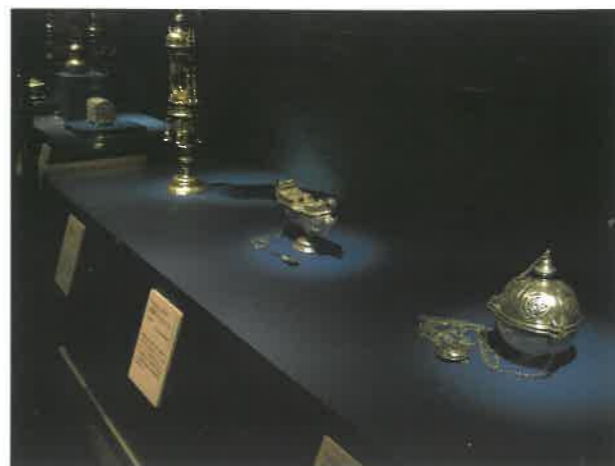
▲ポルトガル国立古美術館の銀器

このように、石見銀山の開発、石見銀の流出に始まり、石見の技術をうけた日本の国内後発鉱山の開発とさらなる銀生産の発展が、今日まで16世紀の東西文化交流の直接・間接的な物証を多く残し伝えることになったということをご多くの方々に感じていただけたのではないかと思います。そして、併せて、世界遺産石見銀山の展覧会を通して、400年の時を越えて再び、私たちを含め東西の人々や文化の交流をさらに豊かにすることができたのではないかと思います。