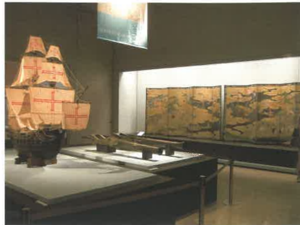
▲「西欧文化の到達」コーナー

をとりまく東アジア海域の大きな政治的・経済的な変革のうねりを、迫力をもって実感したという声を聞くことができました。併せて、会期中には、体験学習的な催し物も行き、親子で参加された皆さんを中心に多くのご参加をいただきました。たとえば、実際に職人さんをお招きして、400年前に南蛮人が日本へもたらした、つい最近まで親しまれてきた金平糖やボウロを実際にご作ってくださる講座を開催し、南蛮渡来の文化を実感していただきました。(9ページ参照)