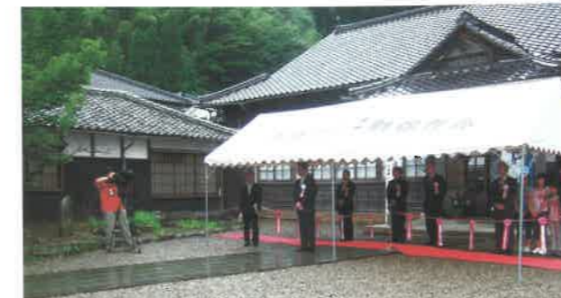
▲雨のオープニング

今回の展覧会は、世界遺産登録の祝賀はもとより、石見銀山遺跡の価値を県内外に情報発信するため開催されたものです。とかく「分かり難い」と云われる石見銀山遺跡ですが、それを関連する歴史資料を通じて、そのすごさを再認識していただくというのが最大の目的です。展示の構成にあたっては、ユネスコに提出された「世界遺産登録推薦書」で明記された石見銀山遺跡の普遍的な価値を柱として組み立てました。この普遍的な価値とは、①世界的に重要な経済・文化交流を生み出したこと、②伝統的技術による銀生産方式を豊富で良好に残していること、③銀の生産から搬出に至る全体像を不足なく明確に示すこと、であり、このうち②と③の部分を石見銀山資料館で担うこととなりました。特に、②・③にあつては、直接遺跡の価値や歴史性に関わることから、なるべく展示内容と現地(遺跡)が一体となるように心がけました。