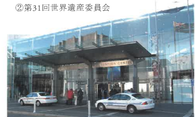
▲会場のクライストチャーチ・コンベンションセンター