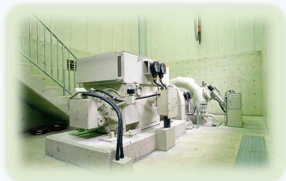
島根県企業局八戸川第三発電所 (使用水量0.6m 3 /s、出力240kW)

県内における出力1,000kW以下の小水力発電の新規開発又は老朽化した既存発電所の再生事業及び維持管理業務に係るもの