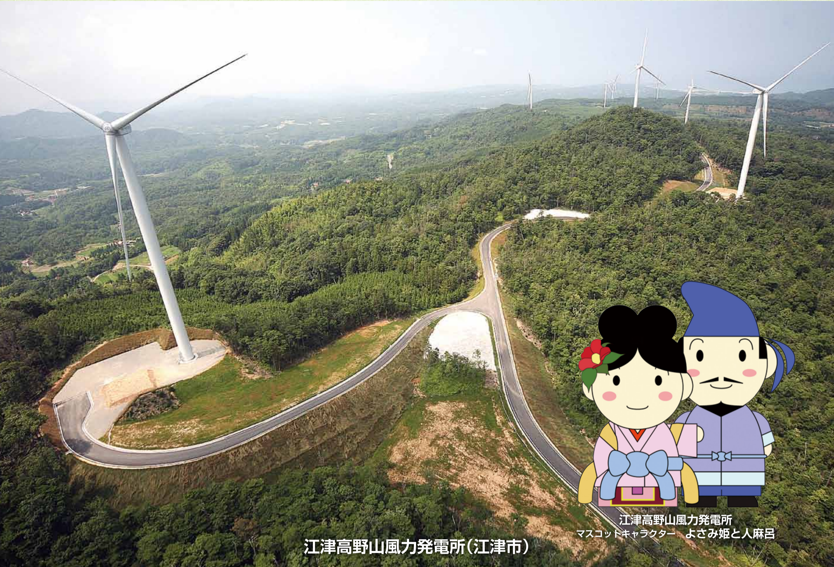
江津高野山風力発電所(江津市)