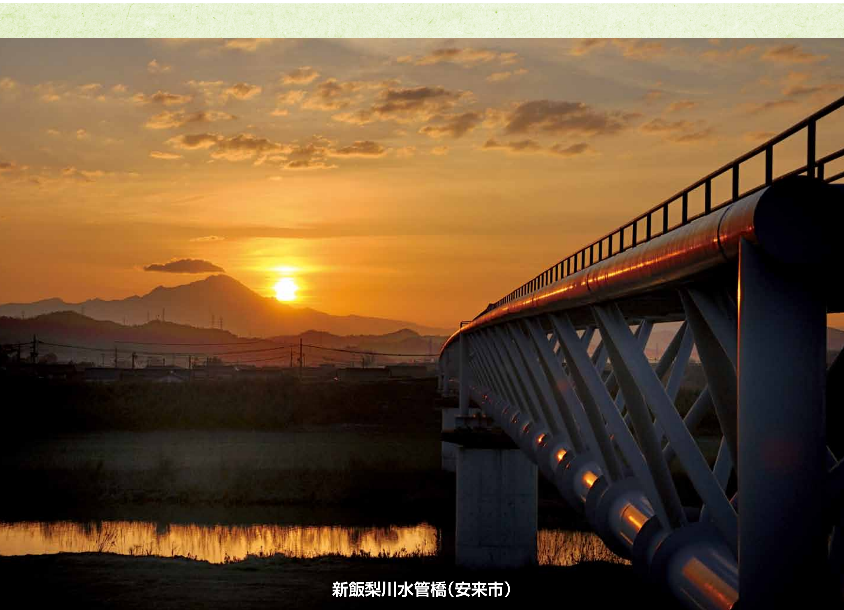
新飯梨川水管橋(安来市)

新飯梨川水管橋は、近くにある今津浄水場で作った水道水を、飯梨川を越えて運ぶ専用の橋です。今津浄水場では、飯梨川の地下を流れる伏流水をくみ上げ、緩速ろ過方式（化学的処理をできるだけ行わず、砂と微生物等の自然の力で浄化する）により時間をかけて、おいしい水道水を作っています。