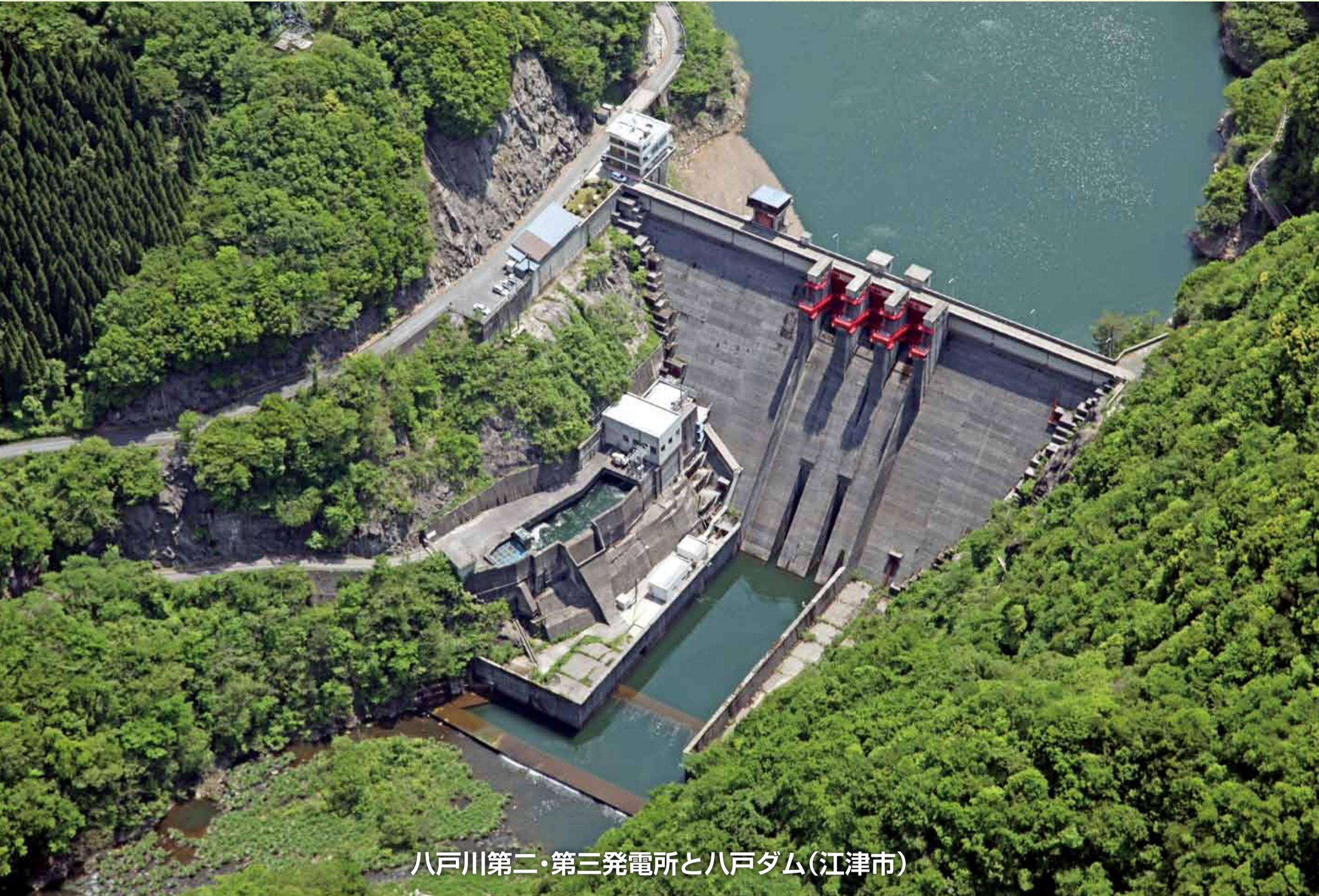
八戸川第二・第三発電所と八戸ダム(江津市)

八戸川第二発電所は、企業局が取り組んでいる老朽化した発電所のリニューアルを最初に終えた水力発電所で、平成28年4月に運転を再開しました。電気事業は、昭和26年に三成ダムと三成発電所を建設したことに始まり、現在は13の水力発電所を運転しています。