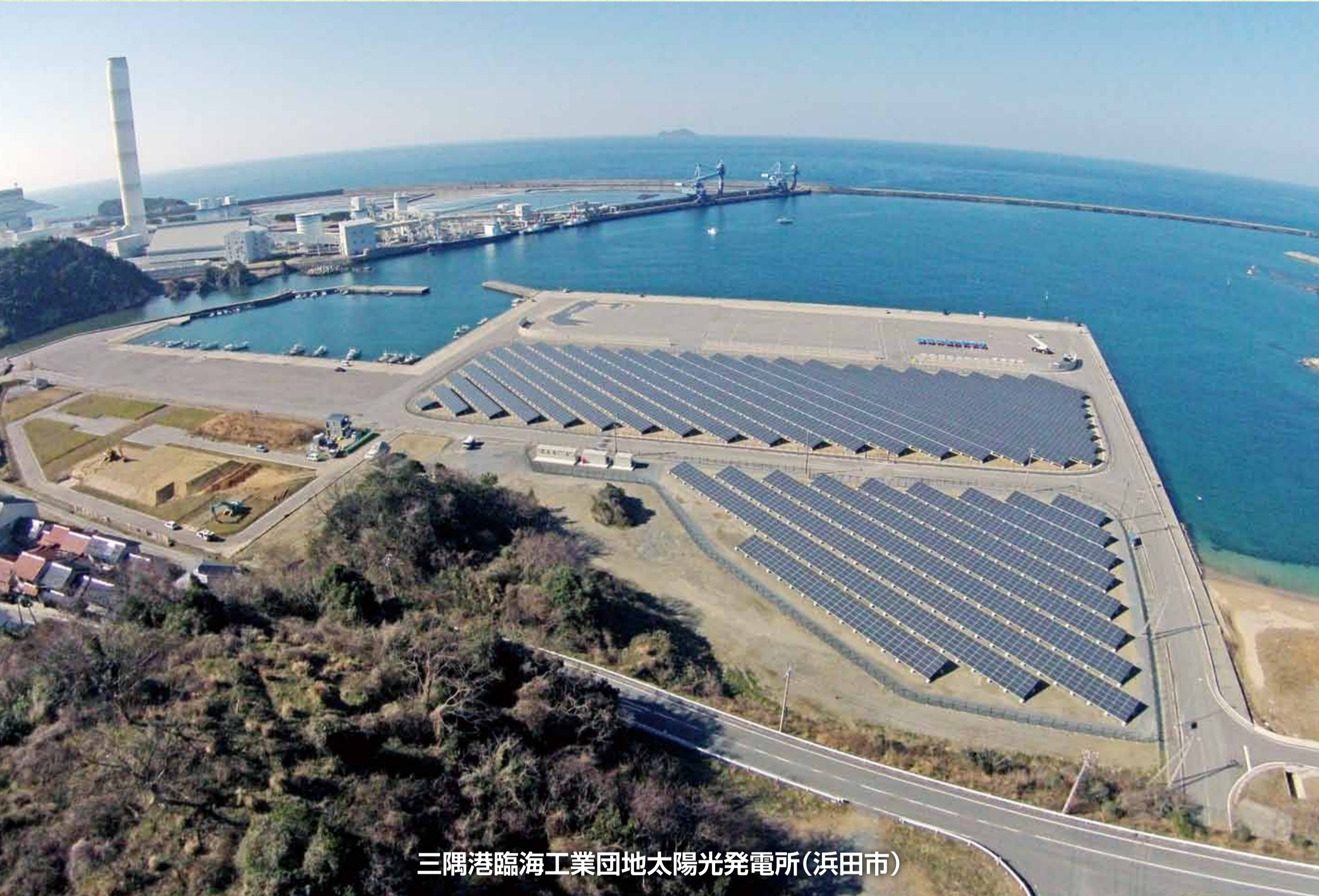
三隅港臨海工業団地太陽光発電所(浜田市)

三隅港臨海工業団地太陽光発電所(1,800kW)は、平成28年3月に運転を開始しました。発電した電力は、約590世帯が1年間に使用する量をまかなうことができます。太陽光発電所は、江津浄水場太陽光発電所(430kW)、江津地域拠点工業団地太陽光発電所(1,200kW)を含め3カ所で運転し、これらのほか、石見空港太陽光発電所(3,490kW)の建設を行っています。