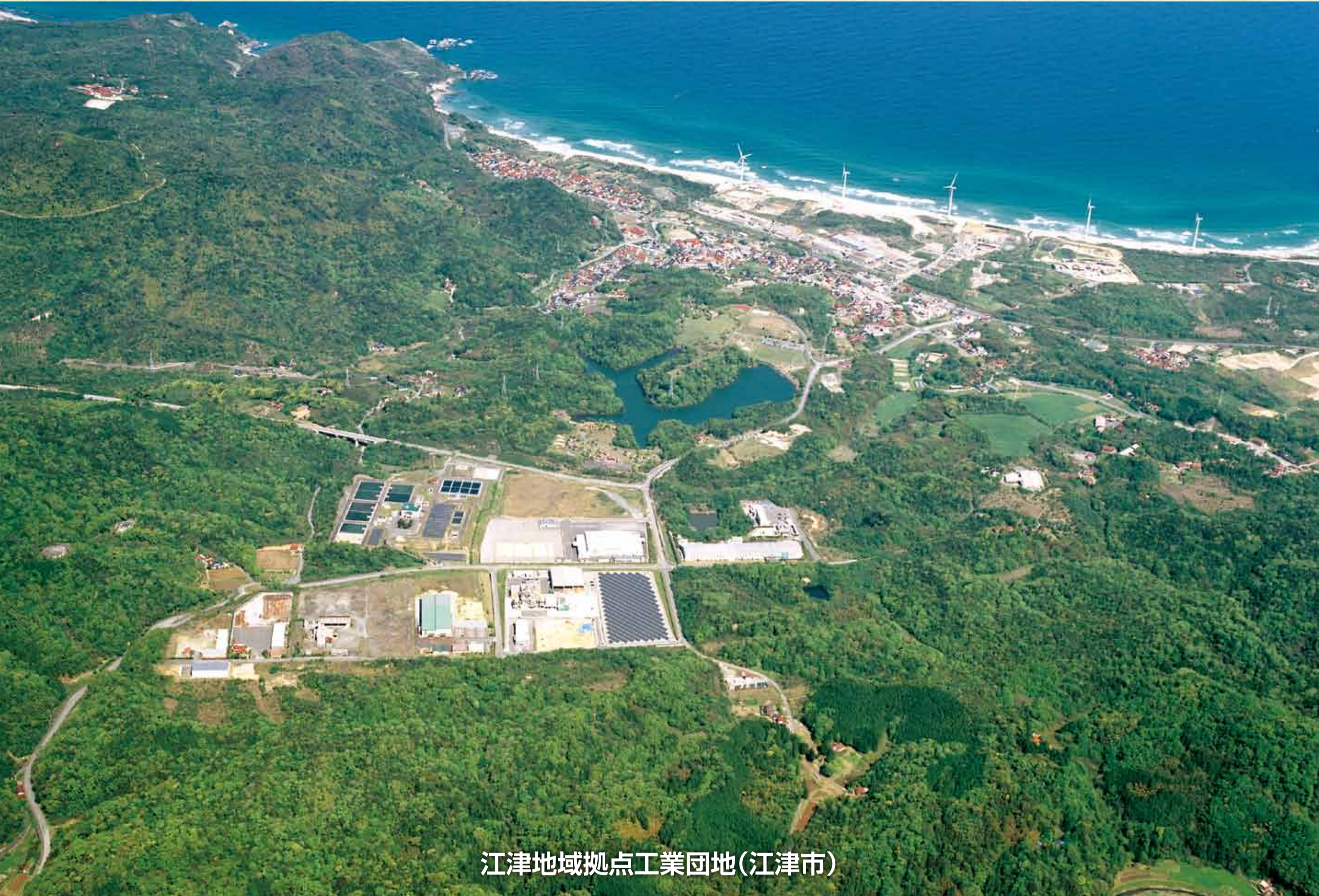
江津地域拠点工業団地(江津市)

江津地域拠点工業団地は、江津市の市街地から約5km東方の平坦な丘陵地にあり、国道9号までは2kmです。江の川の良質で豊かな水が最大の魅力です。平成15年9月には、高速道路（江津道路）も開通し、浜田自動車道を経由すると山陽圏・近畿圏と江津市の距離はますます身近なものとなっています。