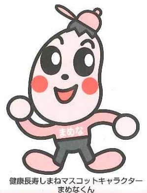
健康長寿しまねマスコットキャラクター まめくん