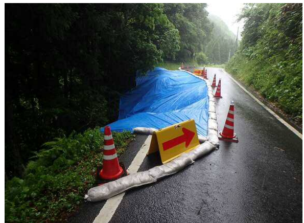
現地状況 (5/18 16:00時点)