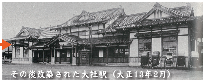
その後改築された大社駅 (大正13年2月)