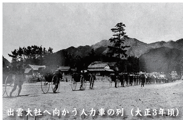
出雲大社へ向かう人力車の列 (大正3年頃)

道路の幅員は六間≒10.8mと、車が普及しておらず国道でさえ四間≒7.2mに満たない道路が多かった当時としては、相当広い道路でした。