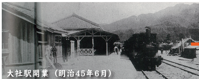
大社駅開業 (明治45年6月)

駅の誘致をめぐる、馬場地区と市場地区で対立したことから、両者の中間地点である現在の駅舎の場所に大社駅は開業しました。当時、駅舎周辺には桑畑が広がり、参拝客は市場地区または馬場地区まで迂回して参拝する必要がありました。