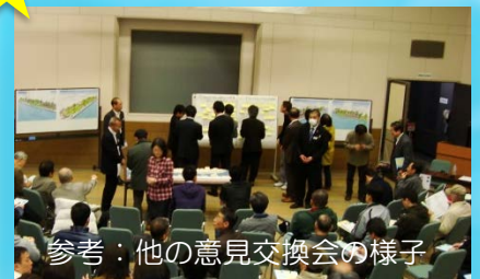
参考：他の意見交換会の様子

主催： 問い合わせ： 島根県土木部都市計画課 TEL 0852-22-5699 FAX 0852-22-6004