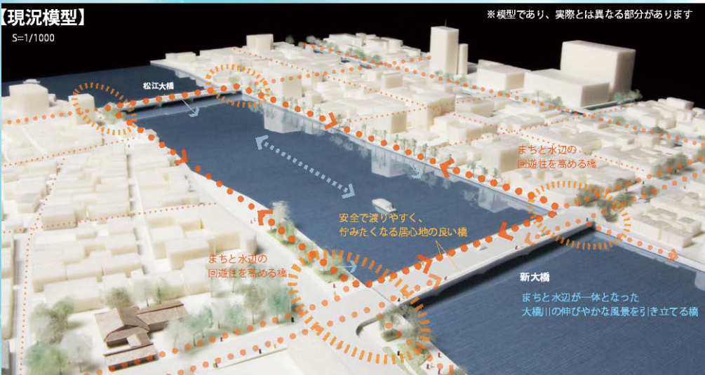
※模型であり、実際とは異なる部分があります