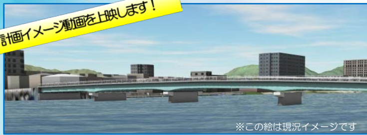
※この絵は現況イメージです