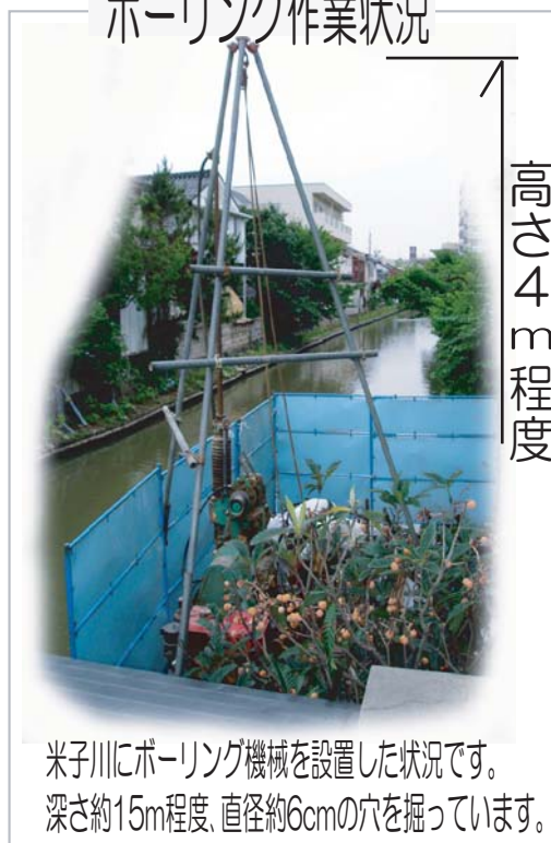
ボーリング作業状況