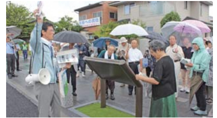
発掘調査成果も合せ歴史案内看板を詳しく解説

雨の中でのイベントでしたが、約1600mの距離を多くの皆さまに歩いていただき興味深く聞いていただきました。