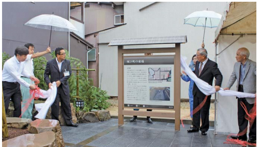
関係者による除幕の瞬間