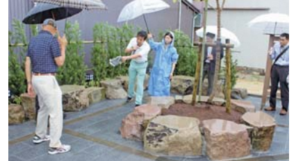
ポケットパークに刻まれた刻印(レプリカ)を紹介