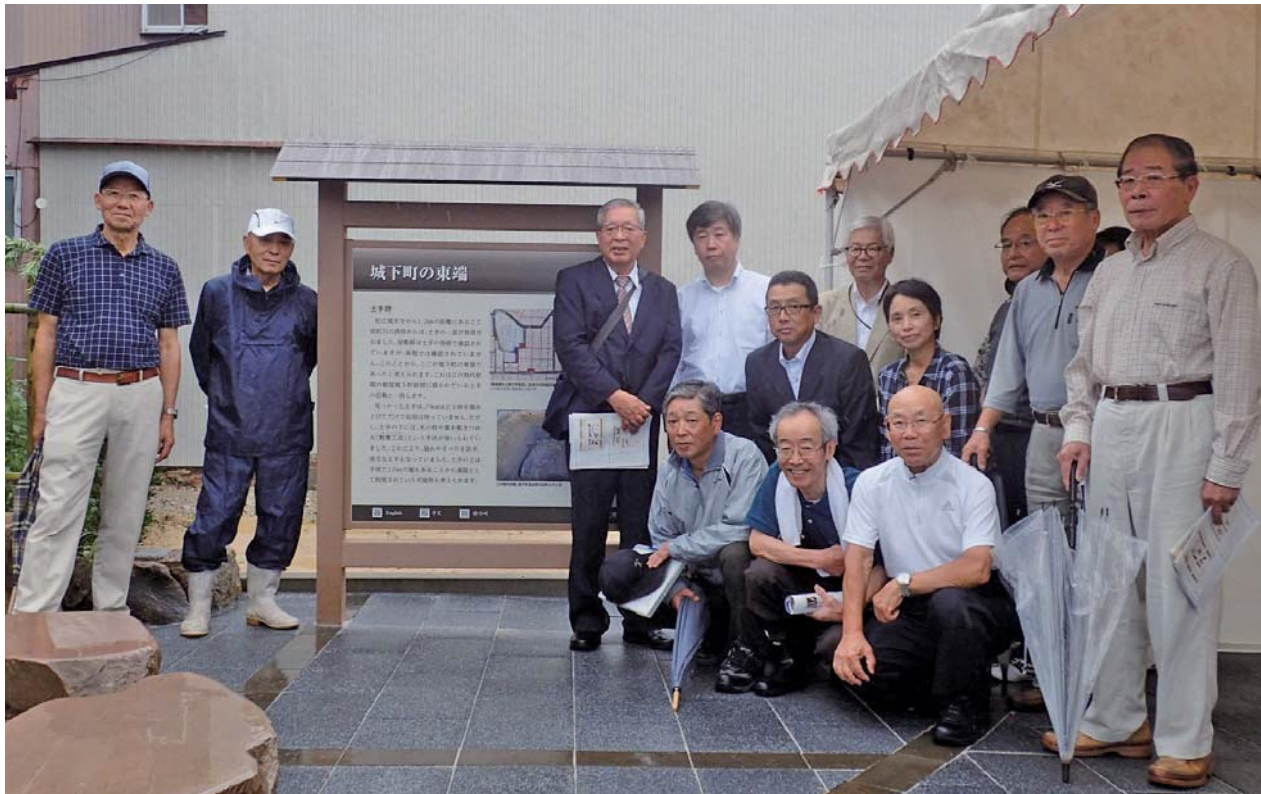
歴史案内看板の前で記念撮影

平成30年7月7日(土) 歴史案内看板とポケットパークの完成を記念して地域の皆さま、地元自治会及び行政機関の関係者等約50名が参加し、歴史案内看板の除幕式が行われました。