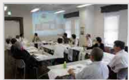
大手前通りみちづくり協議会の様子

「大手前通りみちづくり協議会」は、平成19年に地元からの提言を受け、県や松江市、沿道地区の代表者により設立されました。平成24年までに4回開催され、郵便ポストのデザインのほか、舗装材、照明灯、街路樹、ポケットパーク、米子橋の高欄、歴史資源の活用など、街路のデザインの検討を行いました。