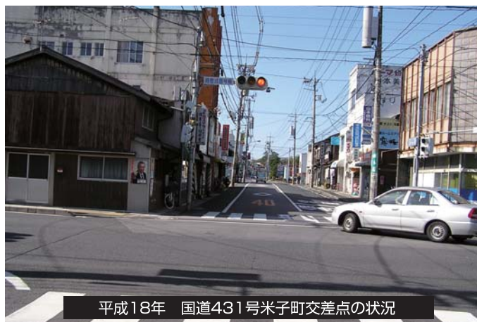
平成18年 国道431号米子町交差点の状況

※1 用地取得率：土地所有者・関係人数全体に対する契約済の土地所有者・関係人数の割合としています