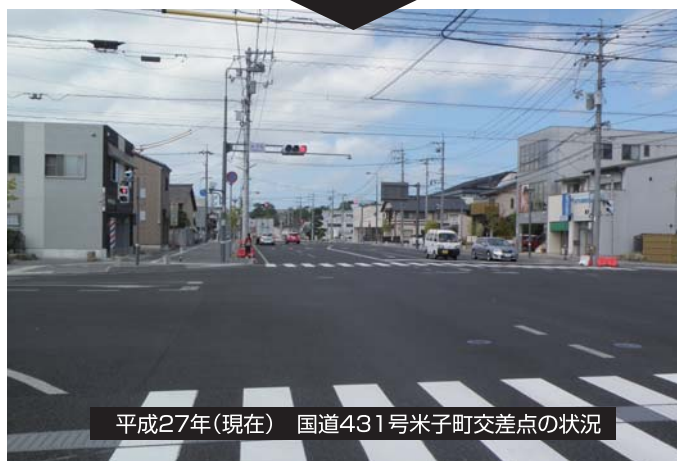
平成27年(現在) 国道431号米子町交差点の状況