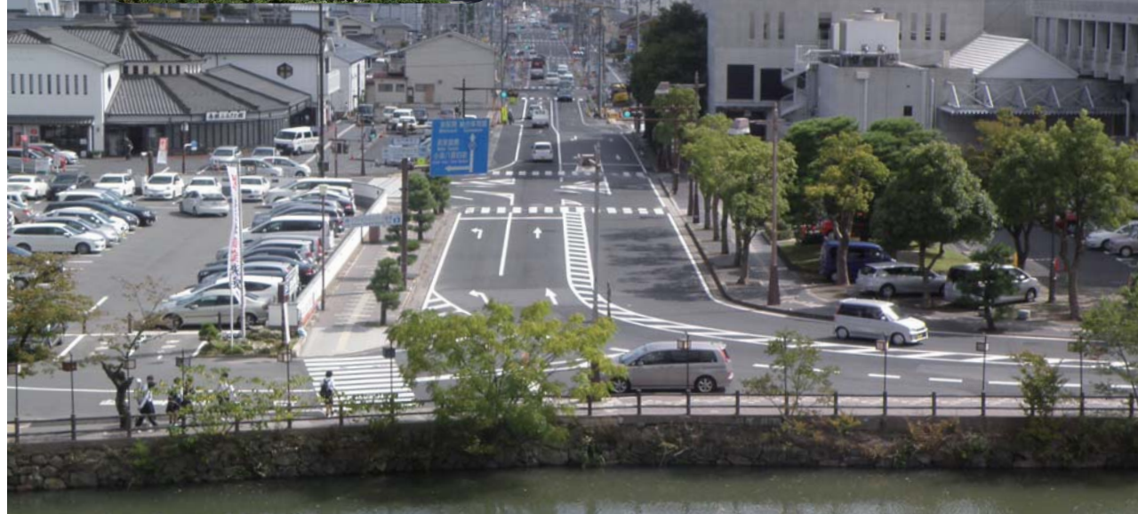
松江城二の丸の櫓から望む大手前通り