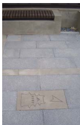
ポケットパークにはお城の方向を示すタイルが

残り、昭和10年の国宝指定を経て、昭和25年に文化財保護法が施行されたことにより重要文化財に改称されました。 長らく重要文化財として指定されていた松江城ですが、近年、国宝化を望む声が高まり平成22年には市民の署名が12万件を達成。平成24年5月には文化財調査により築城の時期を示す祈祷札が発見され、国宝化の後押しとなりました。 松江城の国宝化とともに城山北公園線の整備を進めてまいります。関係者の皆さまのご協力をいただき、着実に整備を進めてまいりますので、今後ともご協力のほどよろしくお願いいたします。