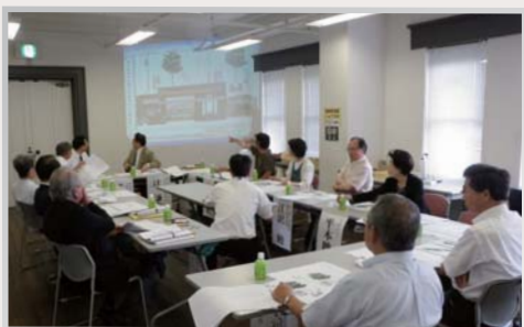
大手前通りみちづくり協議会の様子

「大手前通りみちづくり協議会」は、平成19年に地元からの提言を受け、県や松江市、沿道地区の代表者により設立されました。平成24年までに4回開催され、郵便ポストのデザインのほか、舗装材、照明灯、街路樹、ポケットパーク、米子橋の高欄、歴史資源の活用など、街路のデザインの検討を行いました。