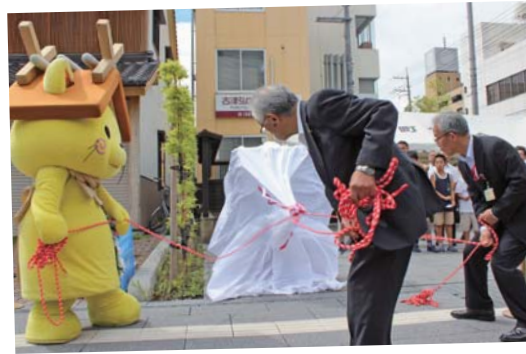
参加してくださった皆さん、 ありがとうございました。