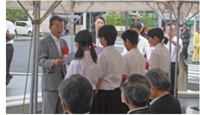
橋名板の書体に採用された優秀作品の揮毫者の4名に松江県土整備事務所長から感謝状を贈呈しました。