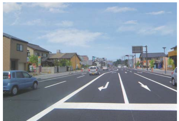
整備後 平成25年7月(米子町交差点)

全長約1kmの城山北公園線は、今回の一部開通により整備率が約30%となりました。