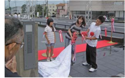
揮毫者児童と保護者による親柱の除幕の様子。橋名板がついにお目見えです。

式典では、米子橋の橋名板の書体を揮毫した当時松江市立母衣小学校六年生だった松江市立第二中学校の生徒さん達に感謝状が贈呈されたほか、除幕式では、揮毫者と保護者の方が一緒に綱を引き、完成した親柱・橋名板が初のお披露目となりました。テープカットの後の米子橋の渡り初めで