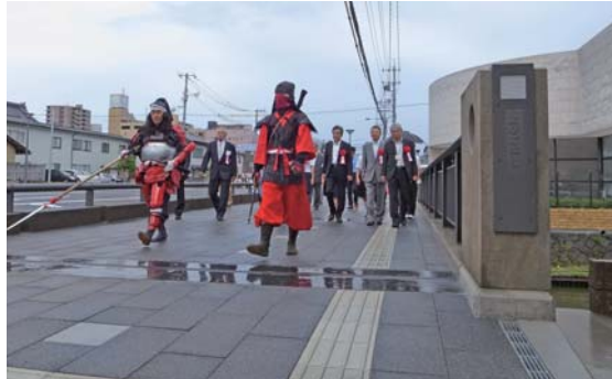
渡り初め。この頃には雨が上がり、出席者の皆さんで完成した供用区間の記念の第一歩を踏み出しました。

は、雲州すいえん隊の掛け声で参加者の皆さんは記念の一步を踏み出し、新しい橋と歩道を歩き開通区間の供用を祝いました。