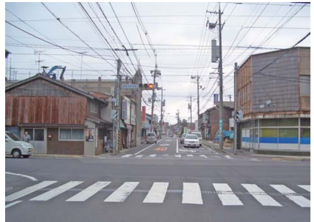
整備前 平成19年4月当時(米子町交差点)