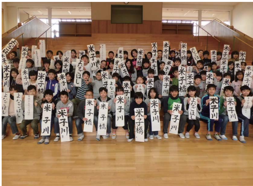
橋銘板の文字を書いてくれた母衣小学校児童の皆さん

米子橋の親柱に取付ける橋銘板の書体を母衣小学校6年生の皆さんにお願いして作成していただき、その中から4点を選定させていただきました。 今回選ばれた作品は6月末に完成予定の米子橋の橋銘板の書体原案として採用されます。 今回ご協力頂いた各学校関係者並びに児童の皆様に感謝すると共に、これにより大手前通りが地元住民の方々にとって、より一層親しみを持っていただければと思います。