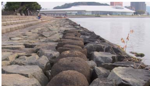
白潟公園の護岸に残っている如泥石

来待石は、凝灰質砂岩で柔らかく加工しやすいのが特徴です。江戸時代には「御止石(おんとめいし)」として、藩外に持ち出しを禁じられるほど重要視されていました。市内では宍道湖南岸を中心に護岸の浸食を防ぐ如泥石(じよでいいし)や墓石、排水溝などとして昔から使われており、市民には馴染み深い石材です。