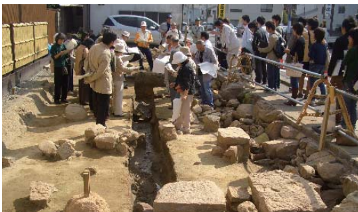
建物の礎石と水路石組み裏側の様子が現地説明会で説明されました。(H18 北殿町)

現地での保存が難しい石組み水路などは、近隣で計画するポケットパークに移設し展示することを検討しています。