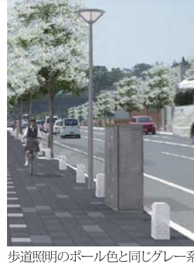
歩道照明のボール色と同じグレー系

今回提示した計画案の詳細は、「大手前通り(都市計画街路 城山北公園線)」のホームページに掲載しています。