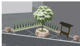
米子町ポケットパーク

休憩のためのスツールは、現地発生材を活用しています。シンボルツリーは、街路と同じなんじゃもんじゃ。