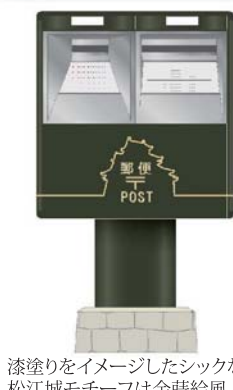
漆塗りをイメージしたシックな色調 松江城モチーフは金時絵風