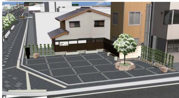
母衣町ポケットパーク

休憩のためのスツールは、現地発生材を活用しています。シンボルツリーは、街路と同じなんじゃもんじゃ。