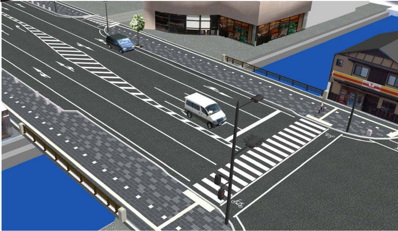
※上記は、米子橋整備イメージです。親柱・高欄のデザイン及び各施設配置は、検討中です。