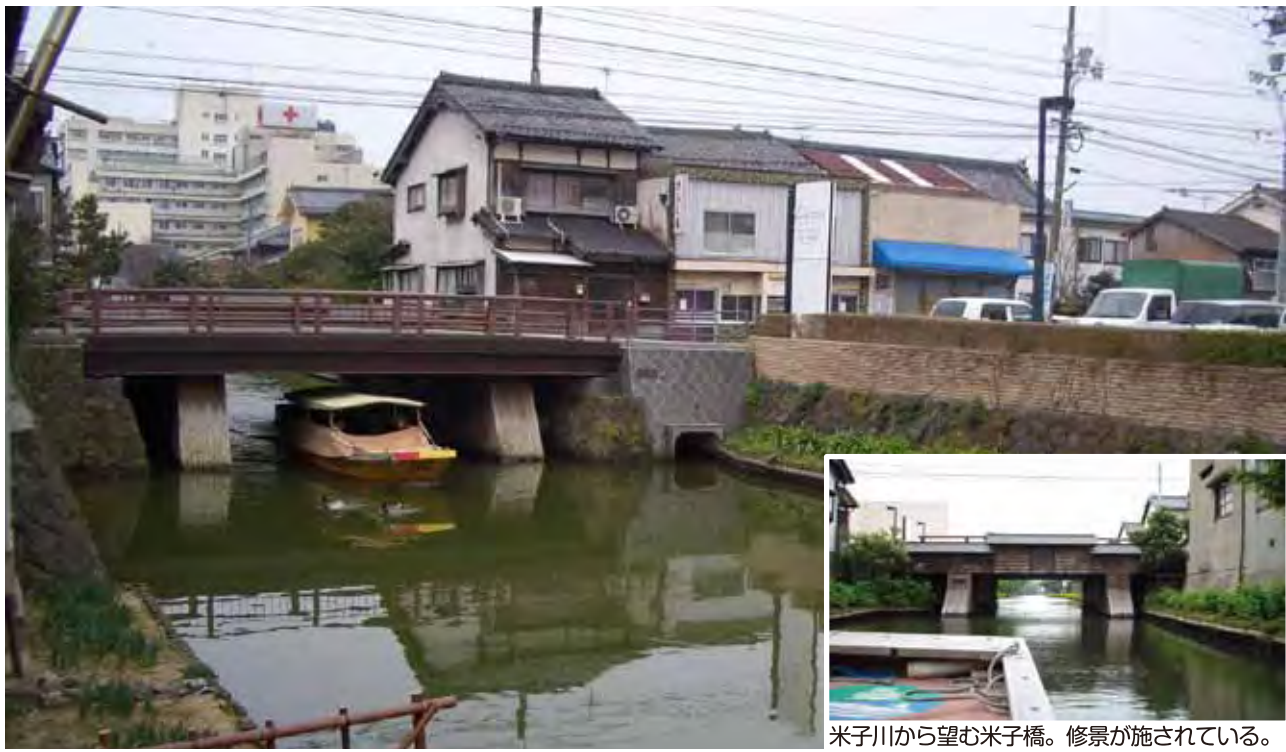
米子川から望む米子橋。修景が施されている。