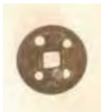
お守りとして身につけていた と思われる穴の空いた古銭