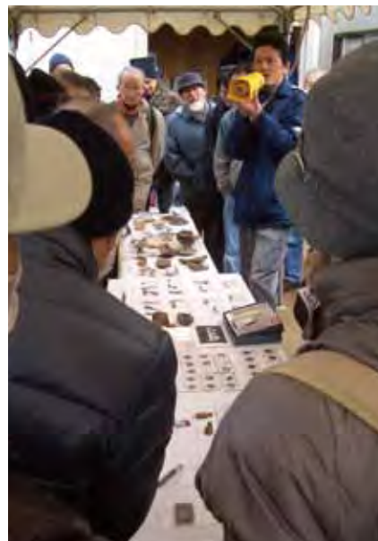
出土品の説明の様子 陶磁器、古銭、キセル、土人形などの当時の 生活用品が多く出土した。