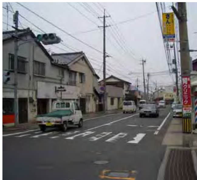
現況の城山北公園線2工区付近。 鍵型街路の見通しの悪い道路です。

城山北公園線の2工区は、平成20年12月に事業認可を受けた、市道南田南北線との交差点からくにびき道路までの延長427.5mの区間です。 事業認可後、平成21年度から測量・調査、工事・用地補償にかかる事業説明等を行い、用地取得の交渉を沿道の地権者の皆様と進めています。 早期供用を目指しますので、皆様のご理解とご協力を頂きますようお願い申し上げます。