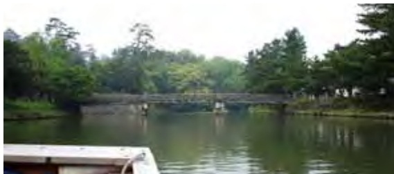
近世の趣深い北田川・宇賀橋周辺 米子橋は、レトロモダンと近世の趣あるエリアの中間地点にある。米子橋を境に川沿いの町は近世の趣に。

昨年2月に発行した「大手前通りみちだより34号」から一年ぶりの発行となります。平成22年は、かねてより検討していた米子町ポケットパークをはじめとする、1工区の計画について地元住民の皆様のご意見を伺いながら詳細設計を進めてまいりました。また、米子橋については、昨年度の大手前通りみちづくり協議会で「城下町松江をイメージさせるような」橋としてデザイン方針が提言されました。 米子橋は、母衣町と米子町の間を流れる準用河川（一級河川及び二級河川以外の「法定外河川」のうち、市町村長が指定し管理する河川のこと）、米子川に架かる橋です。江戸時代には、米子川を境に上級藩士の住む「内山下（うちさんげ）」と中級・下級藩士、町屋が分かれており、米子川は外堀の役割を果たしていました。