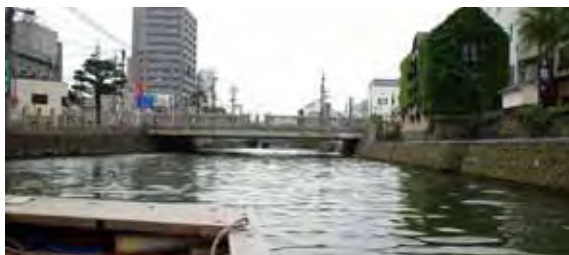
レトロモダンな風情が漂う京橋川・京橋周辺