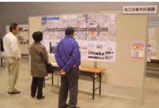
城山北公園線のポスターを読む来場者。この他、市内まちあるきマップなども展示されました。

3月12日くにびきメッセで未来の交通とまちづくりを考える「松江市交通 まちづくりフェスタ」・松江市主催が開催されました。城山北公園線1工区の事業説明ポスターも展示されました。