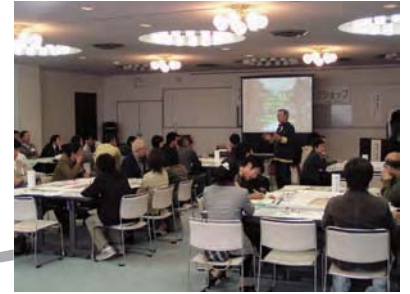
まちづくりとまちづくりワークショップ 地元住民、大学生、商工・観光関係者、NPOなどの参加により、事業後の町並み、活性化のためのアイデアを検討しました。