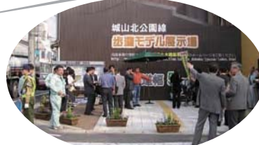
歩道モデル体験会