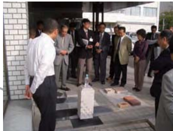
大手前通りみちづくり委員会 地元関係者により歩行空間のデザイン検討を行い県・市に提言しました。