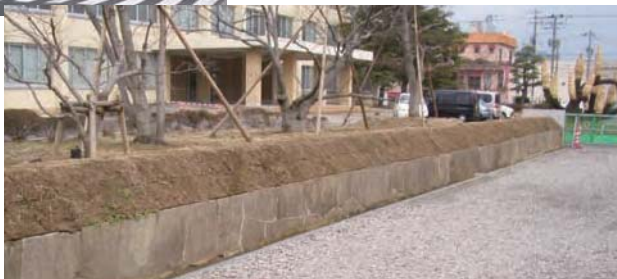
拡幅後の境界に再現された石積

裁判所の石積保存 裁判所が建てられた明治時代に作られた石積を拡幅後も裁判所の境界に再現しています。