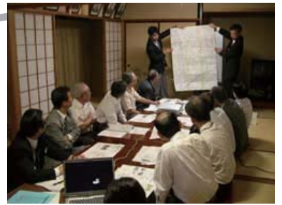
大手前通りまちづくりを考える会 地元住民の代表の方の参加により、地域での身近な問題、街路事業に伴う課題、将来のまちづくり計画等を検討しました。