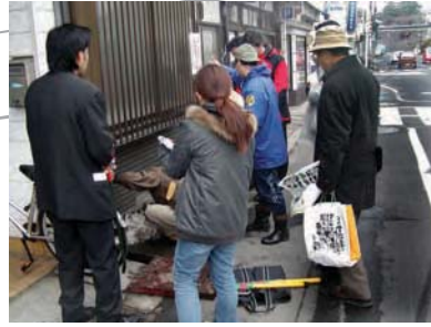
大手前通りの歴史を調べる会 地元住民、学術経験者の参加により沿道地区の文化財や沿道の歴史について調べました。