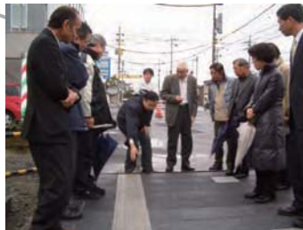
第1回大手前通りみちづくり協議会 舗装材について米子町の歩道予定地でデモンストラーションを行い歩道舗装材の選定を行いました。