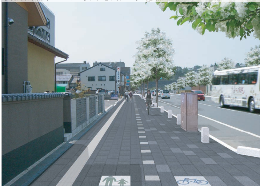
視覚障害者誘導ブロックの視認性を改善した歩道整備イメージ

視覚障害者の方や関係機関(ライトハウス・盲学校)の方々にご意見を伺い、下記の通り決定しました。