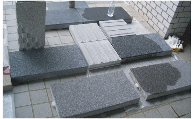
サンプルとして提示した御影石調の擬石平板 3つの色調を提示してご意見を伺いました