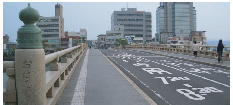
松江大橋 黒御影石に白い自然石の視覚障害者誘導ブロック

視覚障害者誘導ブロックは、一般的には黄色のものが多く見られますが、高齢者に多い白内障などの疾患では黄色を識別するのが困難になるといわれています。こうしたことを総合的に勘案して識別しやすくするためには、色ではなく路面とのコントラストや輝度比※が重要なようです。