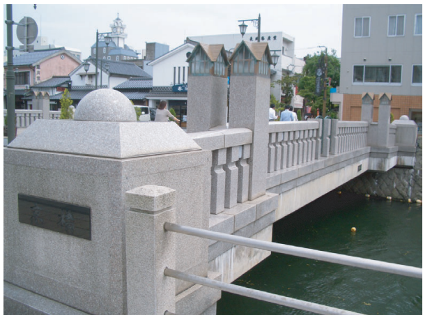
京橋 (裏面 ⑧)

城下町松江をめぐる堀川は、かつては城や城下町を守るとともに、物資の輸送や人々の往来の場にもなっていました。水の都の風情を創出している堀川ですが、今では堀川遊覧船が運航され年間約34万人が利用する松江市の主要な観光資源の一つとなっています。