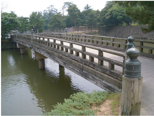
宇賀橋 (裏面 ⑬)