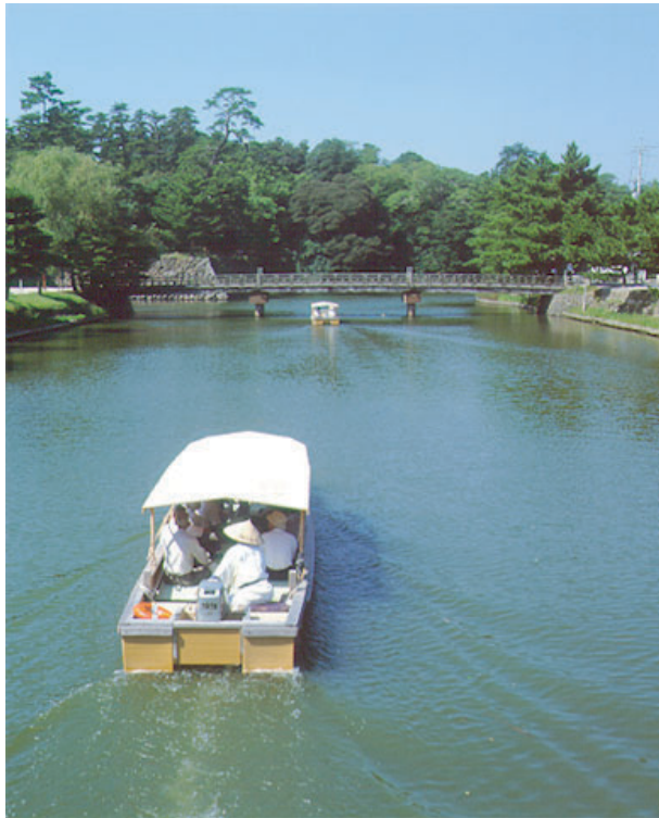
堀川から宇賀橋を望む 城山を背景に城下町の風情が感じられます