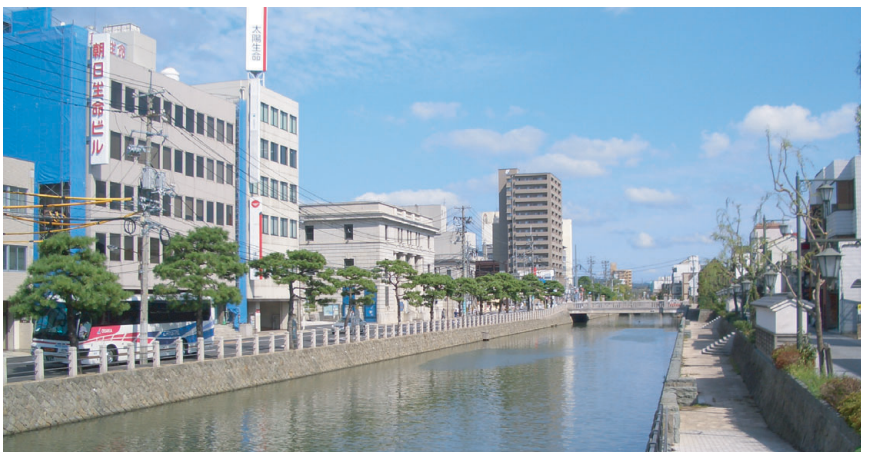
京橋川から京橋を望む カラコロ工房などレトロモダンな建物と調和しています

とす風景を楽しむことができ、遊覧ルートにある十数カ所の橋をくぐるのも乗客の楽しみの一つになっています。 大手前通り周辺においては、米子川が遊覧船の運航ルートとなっており、米子橋上から遊覧船が通過するのを見ることが出来ます。 今回は、遊覧ルートの橋をご紹介します。(裏面に続く)