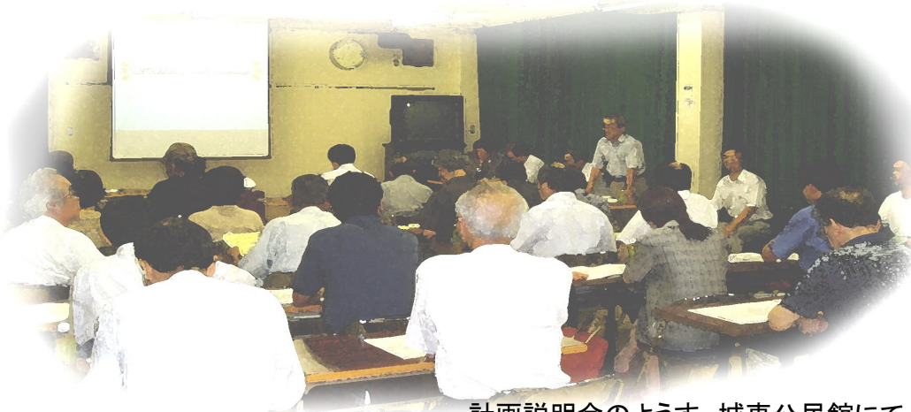
計画説明会のようす 城東公民館にて

説明会では、街路設計・事業予定・用地建物調査・意向調査・用地補償に関してご説明致しました。