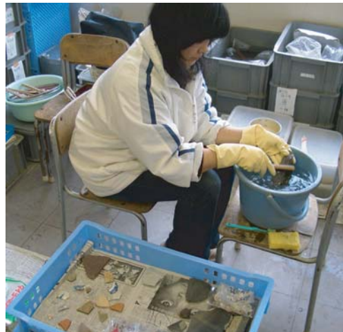
発掘された遺物は丁寧に手洗いされます

興事業団により松江城下町遺跡の発掘調査を行っています。昨年より調査が行われてきた裁判所前庭では、2月17日に発掘調査現地説明会が開催されました。 裁判所前庭は、江戸時代の絵図などから武家屋敷であったことが判っています。(裏面参照) 約4ヶ月にわたる調査により、江戸初期から明治までの陶磁器片をはじめとする遺物約6200点が発掘されました。遺物の多くは19世紀前半のもので、遺構としては幕末から明治にかけて作られたと思われる井戸の跡も発見されました。 これら先人の生活を窺い知ることができ、遺物のうち貴重なものは、松江市建設の歴史資料館に展示される予定です。