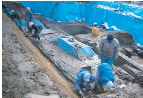
表土から深さ約2mまで発掘調査されました