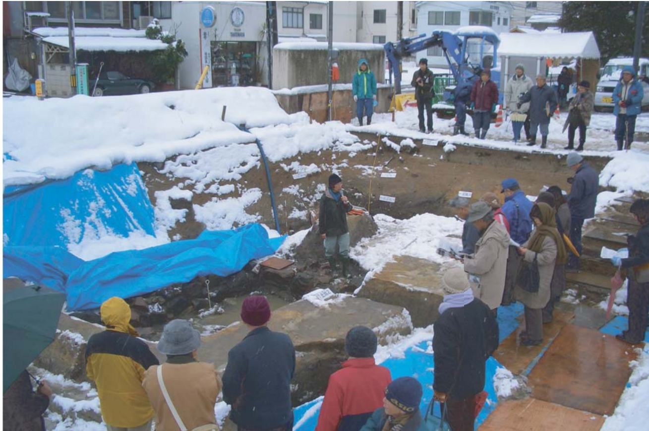
2月17日 発掘調査現地説明会の様子 近年にない大雪にもかかわらずたくさんの方が集まってくれました