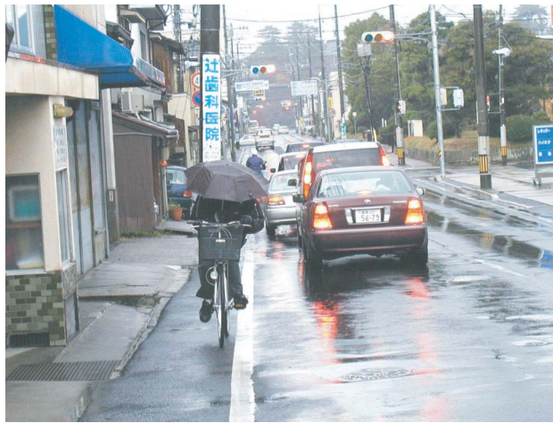
路側帯がせまいので、自転車での通行が危険です。