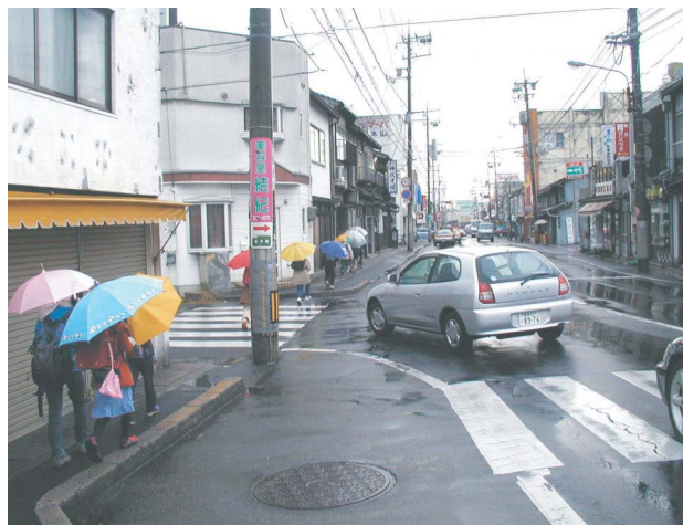
登下校の小学生も大手前通りを使います。