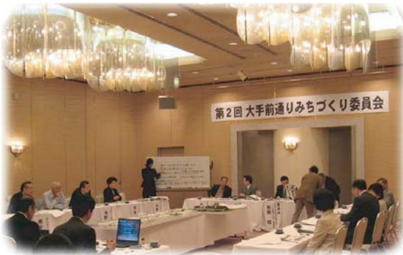
第2回委員会の模様

十一月三日文化の日、第二回大手前通りみちづくり委員会が開催され、街路樹・歩道の舗装材・スポット(小公園)等の整備について話し合いが行われました。前回同様、さかんな意見交換が行われました。最終である第三回委員会は年末もしくは来年一月に開かれる予定です。