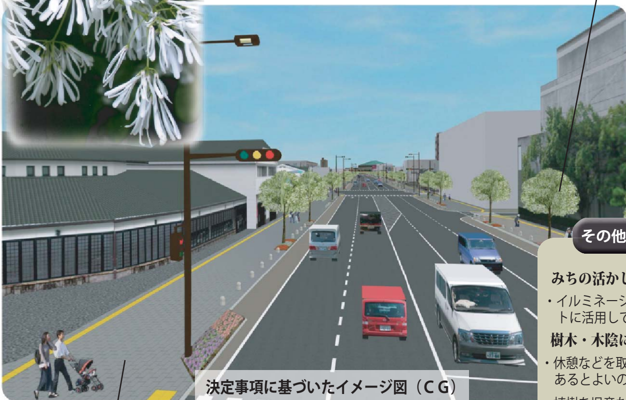
決定事項に基づいたイメージ図 (CG)