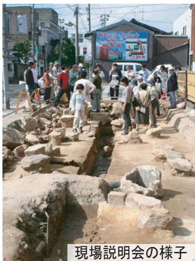
現場説明会の様子