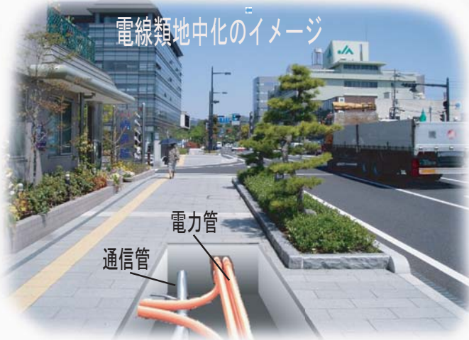
電線類地中化のイメージ

城山北公園線の整備に併せ電線類地中化を行います。電線類地中化とは、みなさんの毎日の暮らしの中で必要不可欠な、電力・電話線、その他の通信線を道路の地下空間へまとめて収容するものです。現在、電線類地中化の設計を行っています。