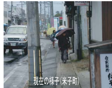
現在の様子(米子町)

城山北公園線では、電線地中化工事の工事期間短縮とコスト縮減を図るために、従来型に比べよりコンパクトで掘削土量の削減等が図れる『次世代型電線共同溝』等新技術の導入を検討しています。