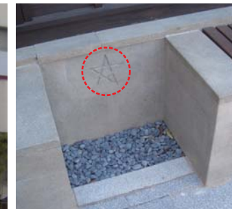
公園のある場所にマークが… 同じマークが松江城の石垣にもあります。探してください。