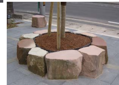
公園内の植栽枡やスツールは、工事の際に出土した石材を利用しています。 この石材の多くは、大海崎石といって、藩政時代から家の基礎や側溝などに使われてきた石材です。松江地方裁判所のソテツ植栽周辺も同じように出土した石材を利用し石積が造られる予定です。

平成20年度には、市民からアイデア募集を行い、寄せられた意見をもとに大手前通りみちづくり協議会で討議。市民のアイデアを取り入れたポケットパークになりました。