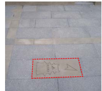
足元にお城のマークが… 矢印の先には、松江城天守閣が見えます。

母衣町ポケットパークは、まちかどの憩いの場、お城の見える視点場「みちの縁側」として、大手前通り周辺地区都市再生整備計画の一環として松江市が整備しました。