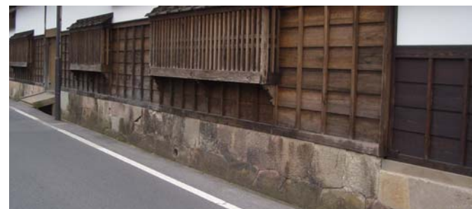
歴史館側の基礎石垣は、以前の建物板塀の基礎がそのまま使われています。

松江歴史館の前の堀沿いの通りです。松江歴史館完成に合わせて一期工事が完成しました。引き続き、第2期整備計画において、松江歴史館から物産観光館までを整備する予定です。平板に使われている石材は、松江市の特徴的な石材である「来待石」です。