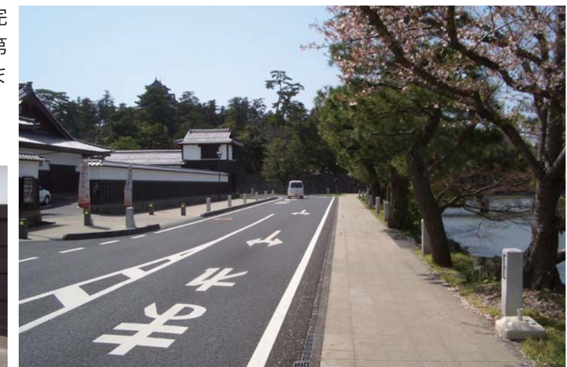
歴史館北側には、フットライトが設置してあります。