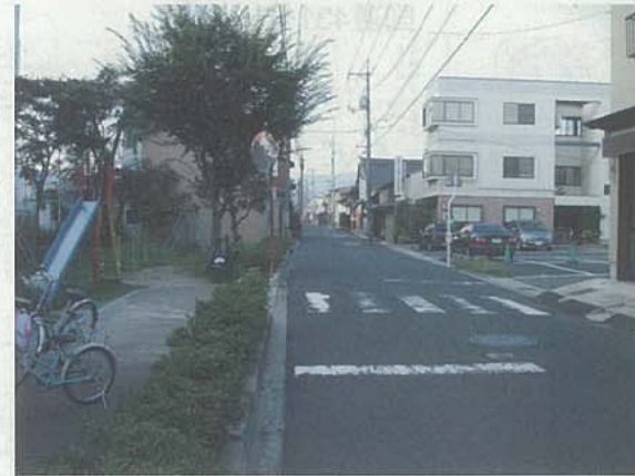
現在の米子町大橋川線