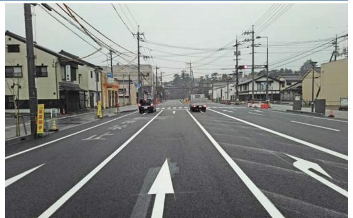
殿町交差点東側車線の様子 (松江城方向を望む)