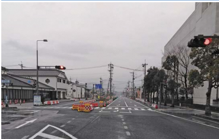
物産館前交差点付近暫定3車線供用の様子 (くにびき道路方向を望む)