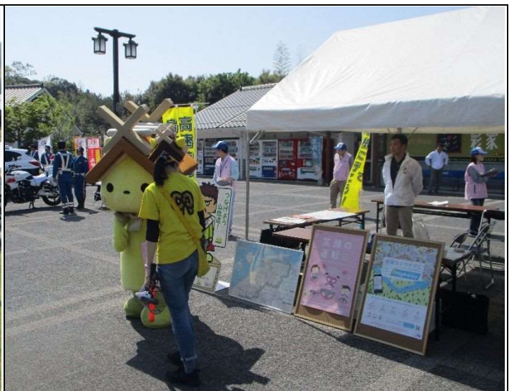
高速道路推進課のブース前でPRしてくれました！