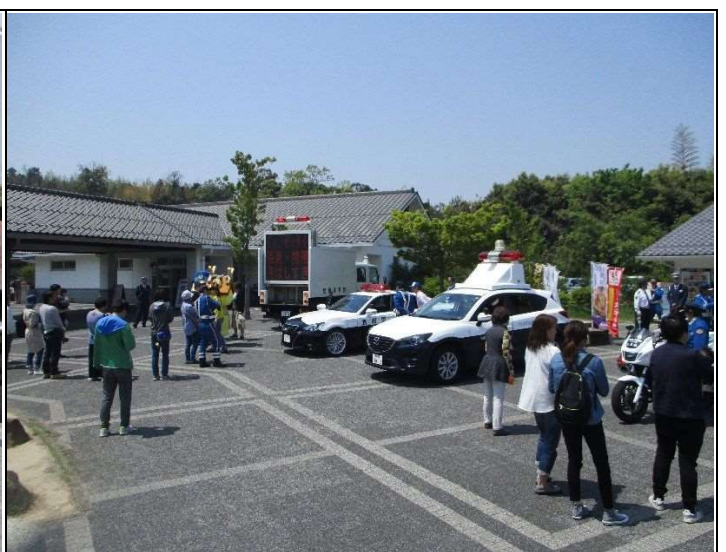
晴天に恵まれ、大勢の方が来場されました

行楽シーズンは観光地を中心に交通量が増えるとともに、不慣れな土地での運転となる場合も多く、交通事故に見舞われる可能性が高まります。車を運転する際は、普段以上に安全運転を心掛けて頂きますようお願いいたします。