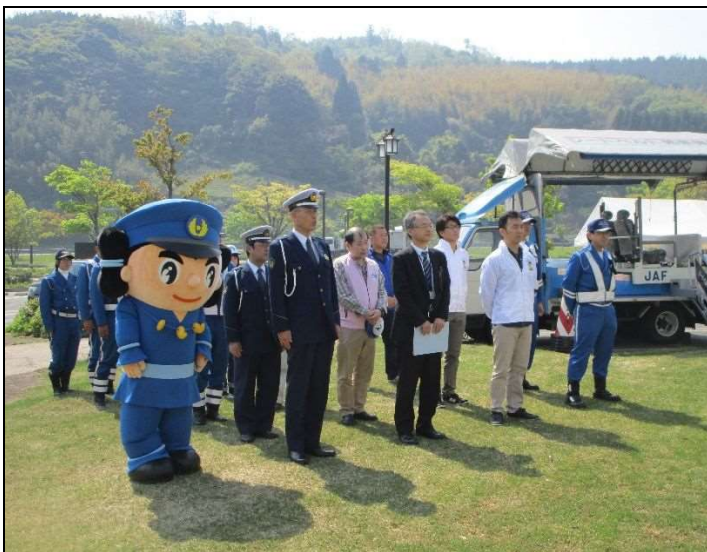
イベント関係者の朝礼にはみこびー君も参加しました

当日は、高速隊パトカーや白バイ、管理隊パトカー等の試乗や記念撮影、島根県立松江農林高校及び松江商業高校の生徒の皆さんによるオリジナル商品の販売等が行われるとともに、「しまねっこ」や島根県警察シンボルマスコット「みこびーくん」も登場するなど大勢の人で賑わいました。