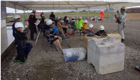
建設機械への試乗体験の様子