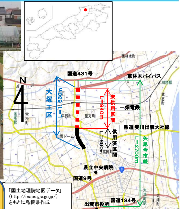
「国土地理院地図データ」 ( http://maps.gsi.go.jp/ ) をもとに島根県作成

一般県道 矢尾今市線は、出雲市矢尾町の国道431号から出雲市今市町の国道184号（旧国道9号）へ至る延長2.7kmの道路です。