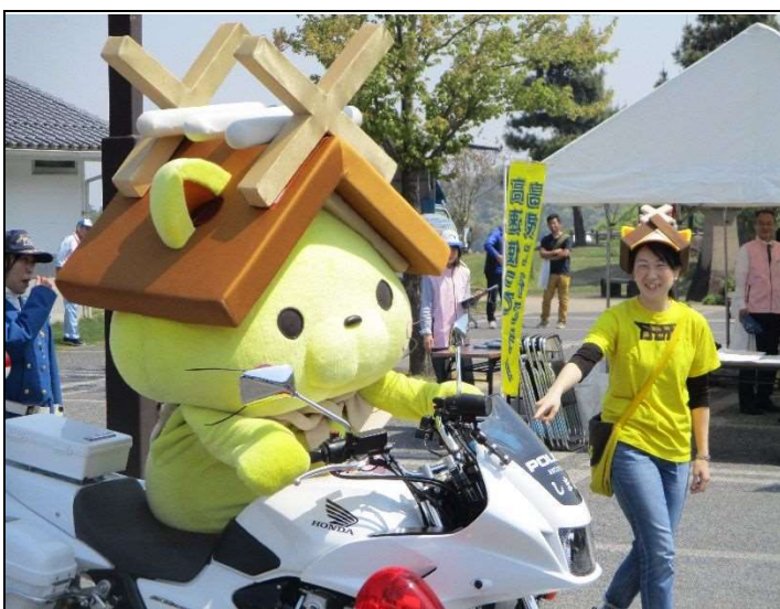
白バイに試乗しようとするも足が上がらず…