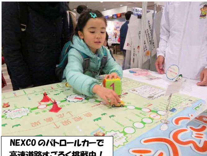
NEXCOのパトロールカーで 高速道路すごろく挑戦中！