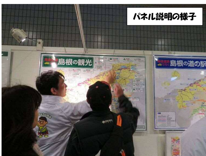
パネル説明の様子