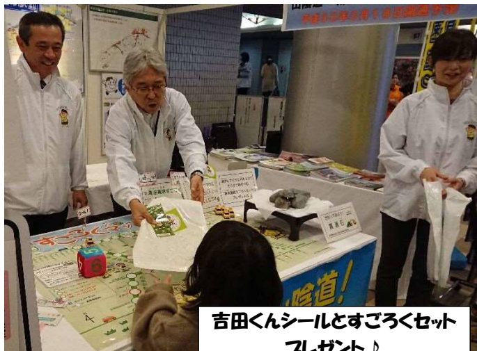
吉田くんシールとすごろくセット プレゼント♪