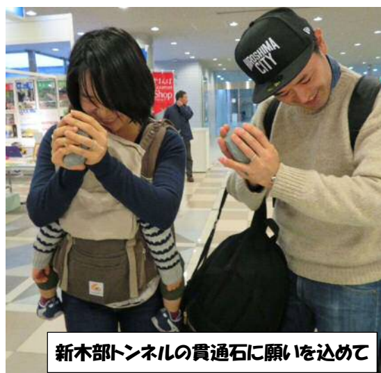
新木部トンネルの貫通石に願いを込めて