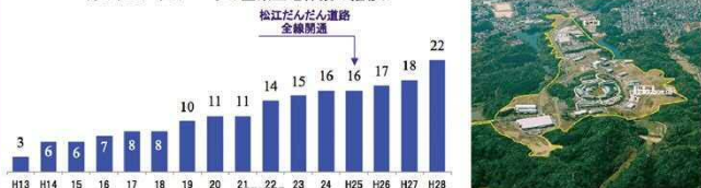
＜ソフトビジネスパークの企業立地件数の推移＞

松江だんだん道路の開通によって交通の利便性が向上し、周辺地域では新たな企業立地、住宅地開発、商業施設の立地が進展しています。