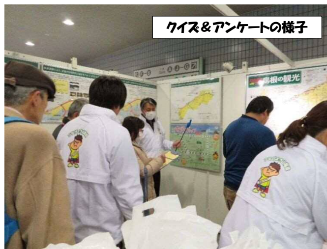
クイズ&アンケートの様子