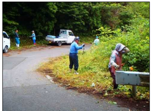
地域住民と連携した清掃・除草作業