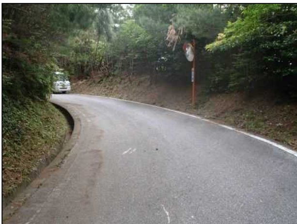
維持管理された林道