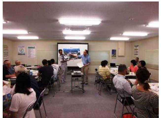
班ごとの意見の発表