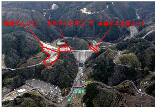
周辺環境整備エリア