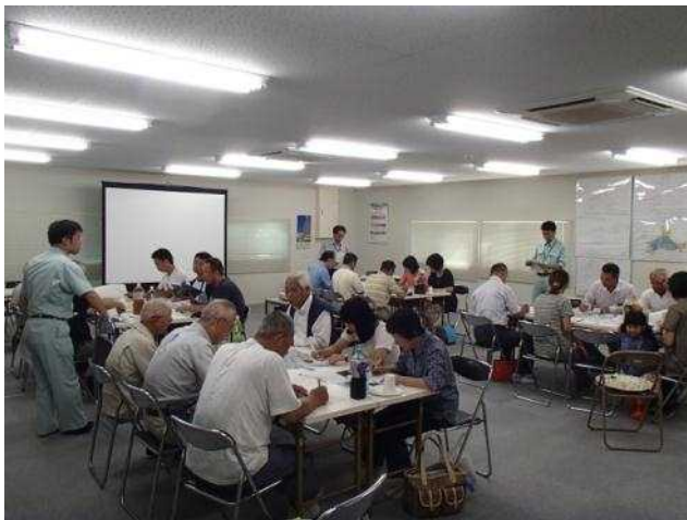
意見交換会の様子

今回は条件を設定しない中で自由な意見を頂戴しましたので、今後、関係機関と協議しながら、実現可能なものについて周辺環境整備に反映できるように検討していきます。