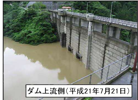
ダム上流側(平成21年7月21日)