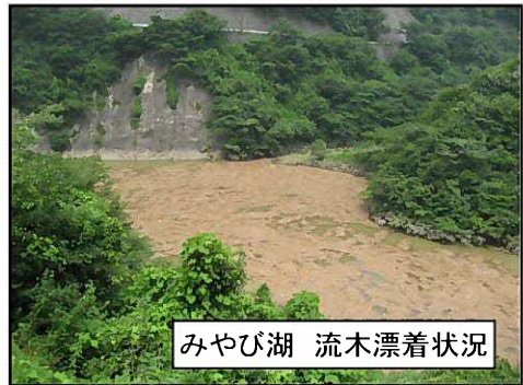
みやび湖 流木漂着状況