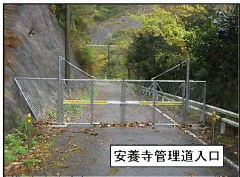
安養寺管理道入口

島根県浜田県土整備事務所 〒697-0041 島根県浜田市片庭町254 TEL. 0855-29-5678