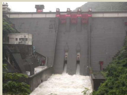
ダムの放流状況(昨年7月7日)