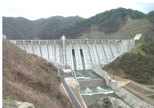
※非常用洪水吐から越流する様子 (試験湛水時の写真です)