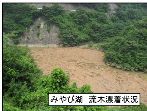
みやび湖 流木漂着状況