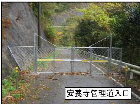
安養寺管理道入口

島根県浜田県土整備事務所 〒697-0041 島根県浜田市片庭町254 TEL. 0855-29-5678