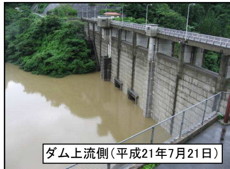
ダム上流側(平成21年7月21日)