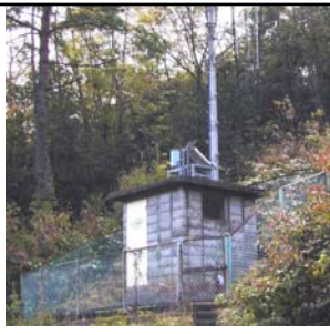
雨量局（嵩山雨量局）

河川に現在どのくらい水が流れているかを観測しています。浜田大橋・中芝橋の近くにあるほか、金城町にもあります。