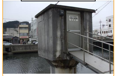
水位局（大橋水位局）

河川に現在どのくらい水が流れているかを観測しています。浜田大橋・中芝橋の近くにあるほか、金城町にもあります。