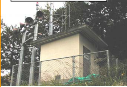
警報局（黒川警報局）

ダムの上流にあります。降雨量を観測し、ダムに流入する水の量を予測するのに活躍します。浜田ダム地点を含めて4ヶ所あります。