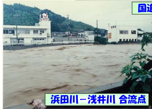
国道9号 田町交差点