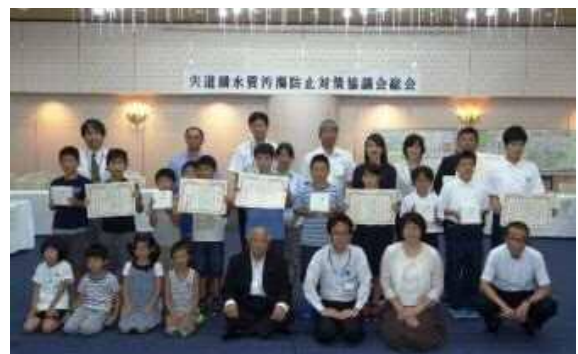
受賞団体の皆さん