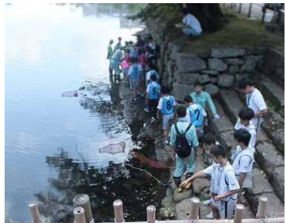
生き物調査実施状況