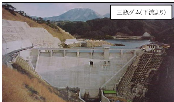
所在地: 島根県大田市三瓶町野城