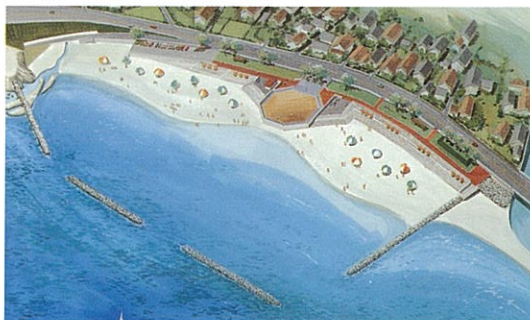
千酌港海岸環境整備イメージ（美保関町） 地域住民の憩いの場また、夏の海水浴レクリエーション機能の拡充