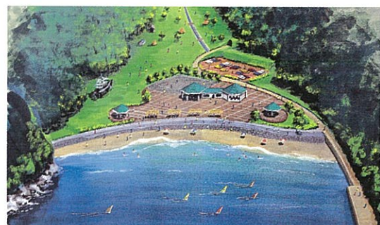
夕浜港海岸環境整備イメージ（西郷町）