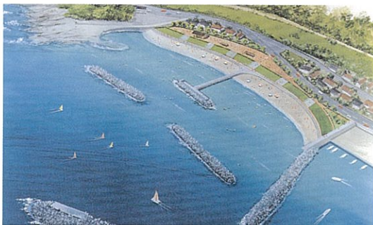
田儀海岸環境整備イメージ（多伎町） 砂浜地の侵食防止や養浜のための離岸堤