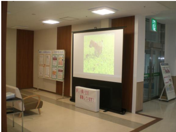
⑦飼い主募集中の犬の紹介(スクリーン)