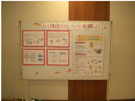
③もしも災害が起こったら、ペットと避難する事を考えよう