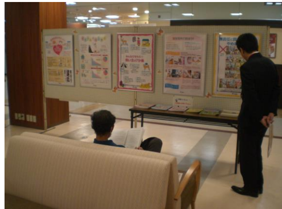
④環境省動物愛護ポスター