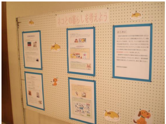
⑥ネコとの暮らしを考えよう