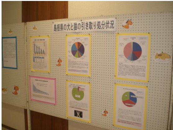
①島根県の犬と猫の引取処分状況等