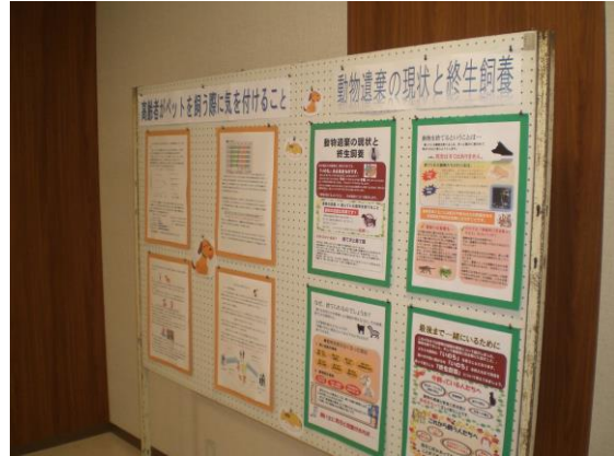
②高齢者がペットを飼う際に気を付けること ⑤動物遺棄の現状と終生飼養