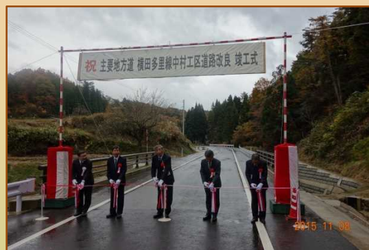
中村工区竣工式の様子