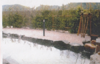
佐白温泉で美人の湯をご満喫