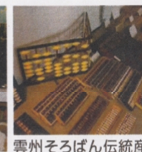
雲州そろばん伝統産業会館も見学

※本ツアーは奥出雲地区の観光素材開発のためのモニターツアーとなります。ツアー終了後、A4用紙1枚程度のアンケートにてご感想をご提出いただけます。その謝礼として粗品を差し上げます