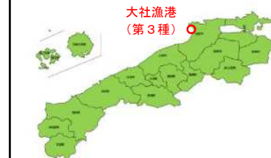
凡例（事業実施年度）